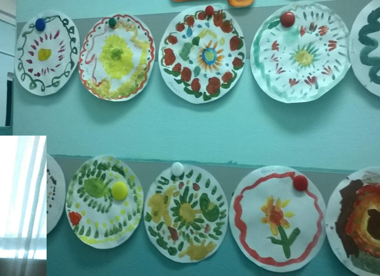
НОД «Украсим тарелочку» (свободное рисование)