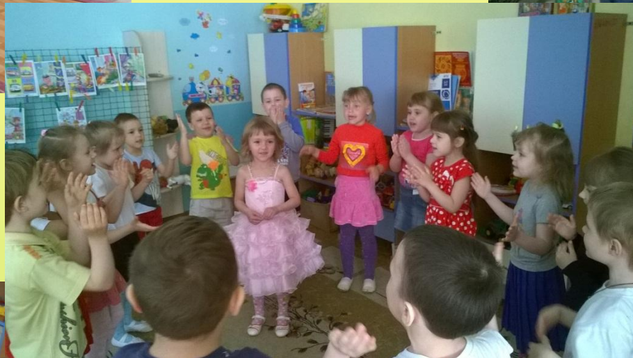
В нашей группе есть традиция – отмечать День Именинника для каждого ребенка. Хороводная игра «Каравай»