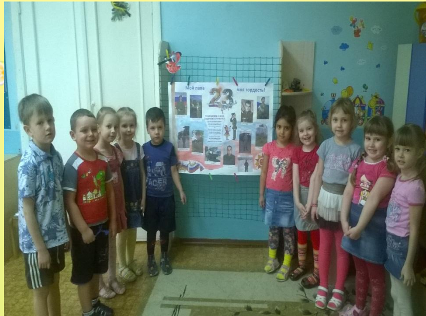
Стенгазета «Моя мама – моя гордость»