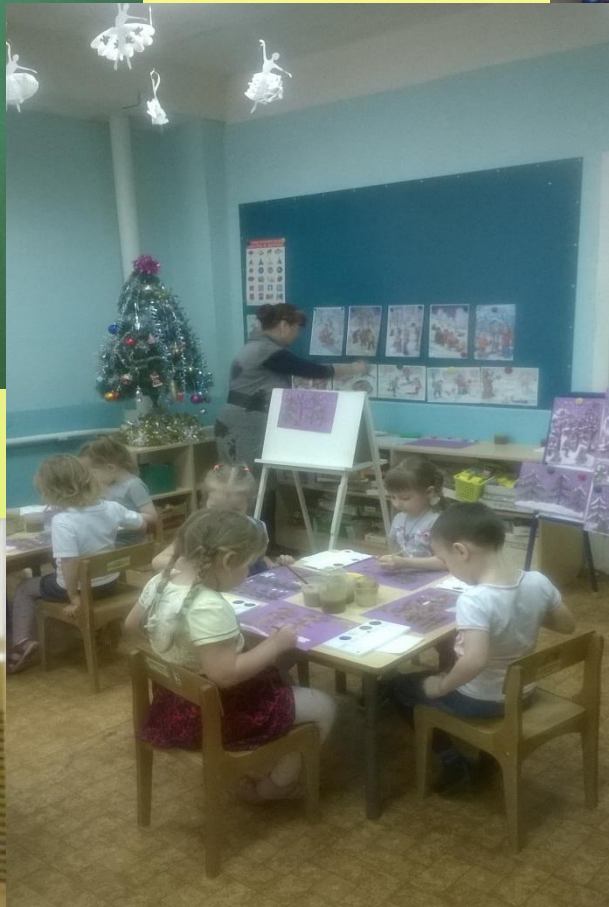
НОД «Зимний лес» (рисование)