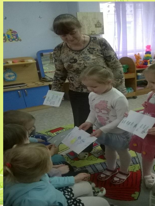
Дети изготовили и подарили книжки малышки ребятам из второй младшей группы № 5