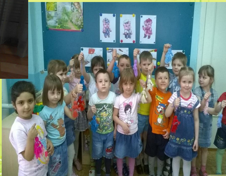
Изготовление куклы из ниток «Берегиня»