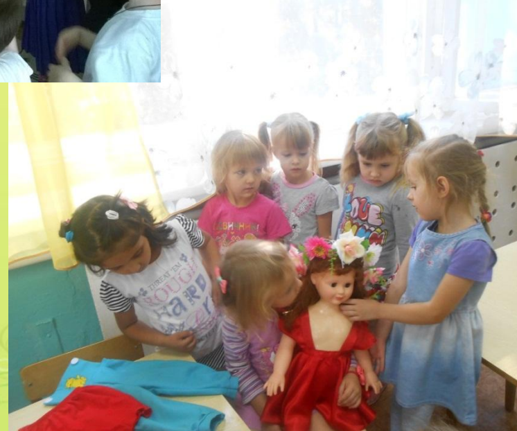
Сюжетно – ролевая игра «Дочки – матери»