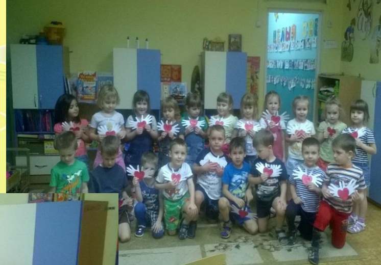
Изготовление открытки на Матери «Мамино сердце в ладошках»