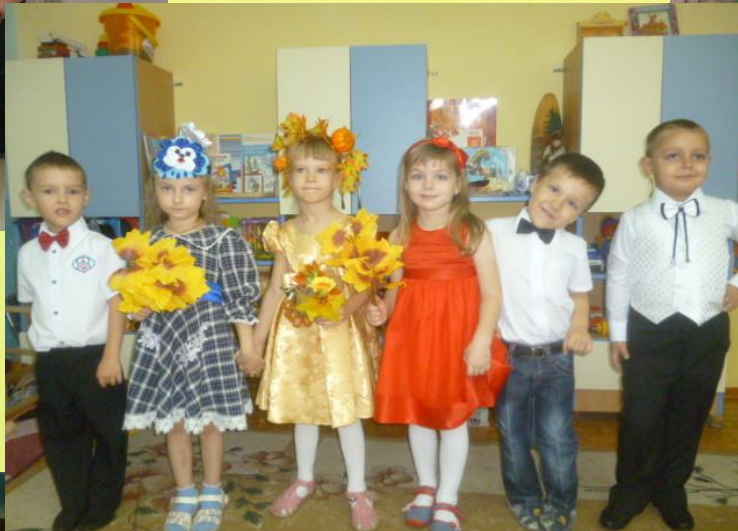
Участие в Осеннем утреннике – девочки в ролях Осень, Тучка и Солнышко