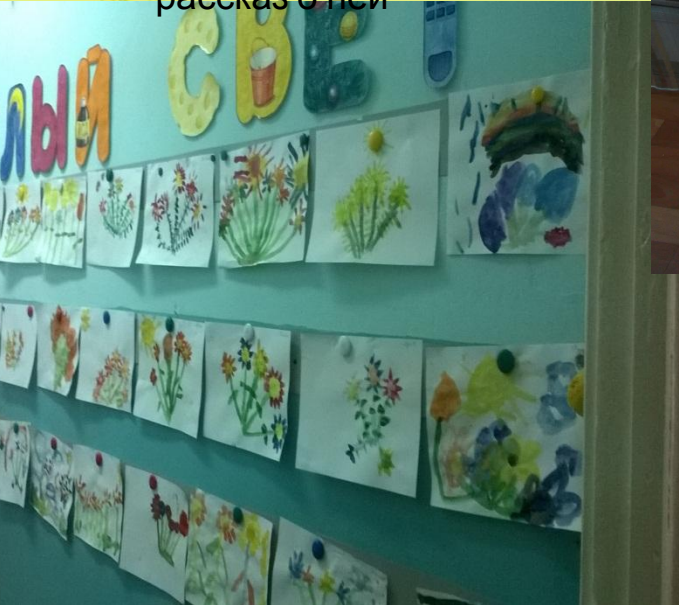
НОД «Букет для мамочки» (рисование)