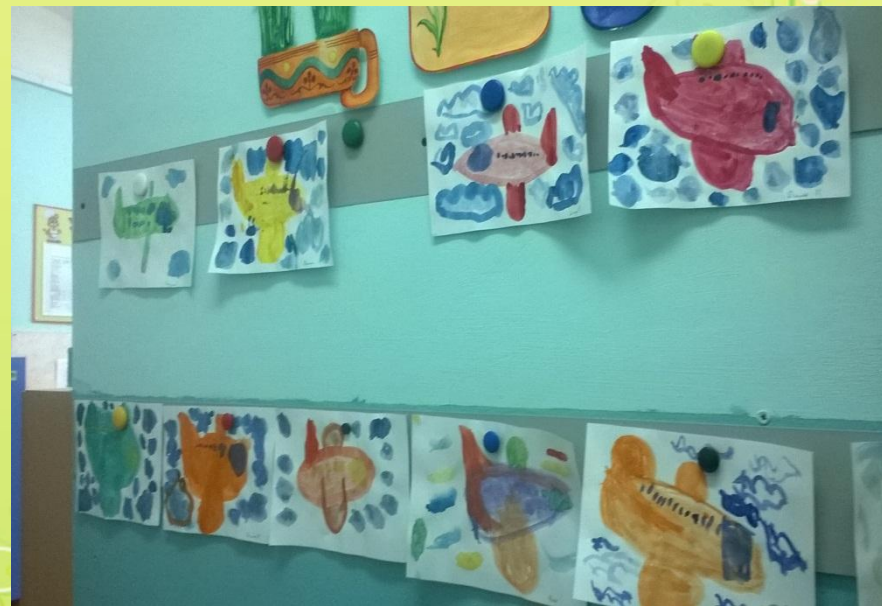
НОД «Самолеты» (рисование)