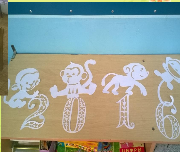
Вот таких весёлых обезьянок – символ Нового года мы сделали с ребятами