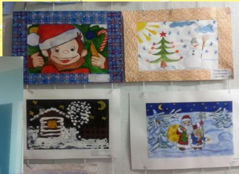
Конкурс рисунков «Зимушка – зима»