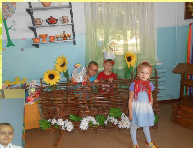
Инсценировка песни «Жили у бабуся два веселых гуся..»