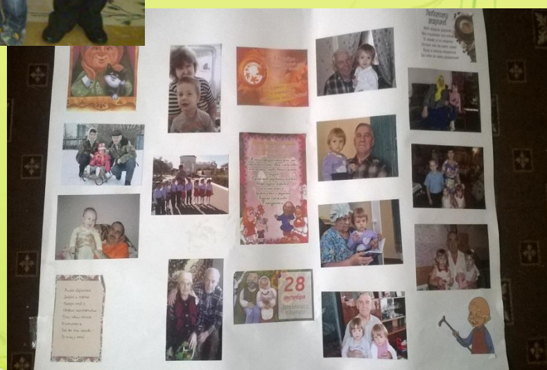
Изготовление стенгазеты «Бабушка рядышком с дедушкой»