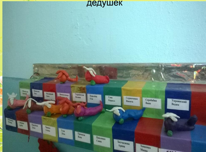
НОД «Веселые вертолеты» (лепка)