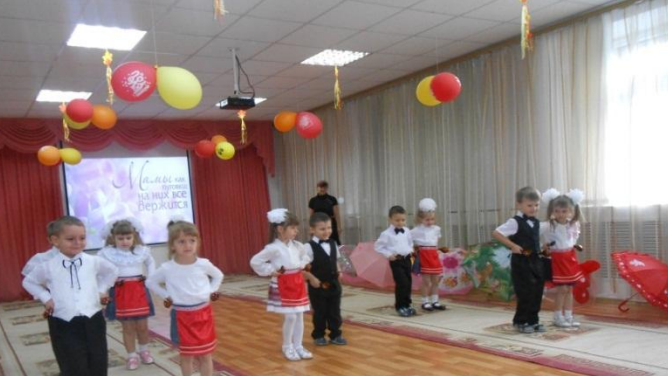
Выступление детей на празднике День Матери в нашем детском саду