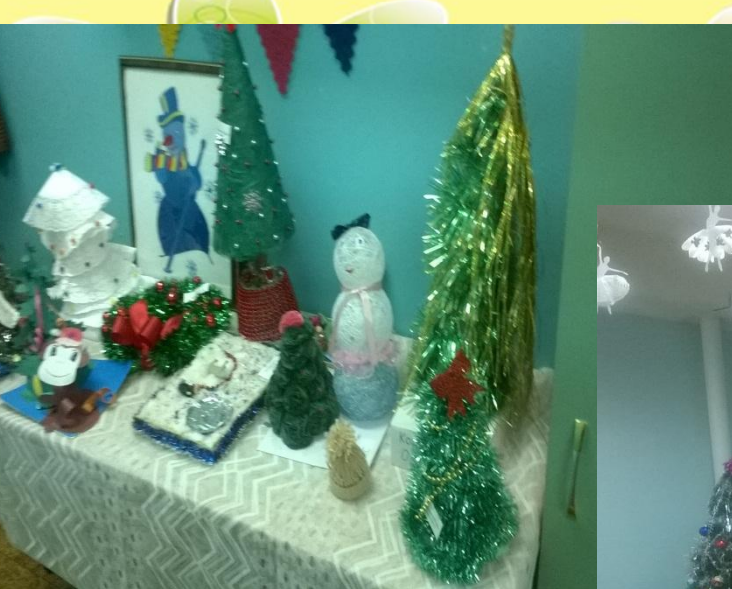
Совместное творчество детей и родителей «Поделки к Новому году»