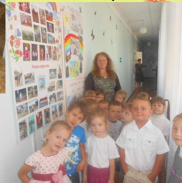
Стенгазета «Россoshь в сердце моём» изготовлена совместно детьми и воспитателями