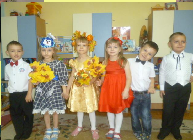
Участие в Осеннем утреннике – девочки в ролях Осень, Тучка и Солнышко