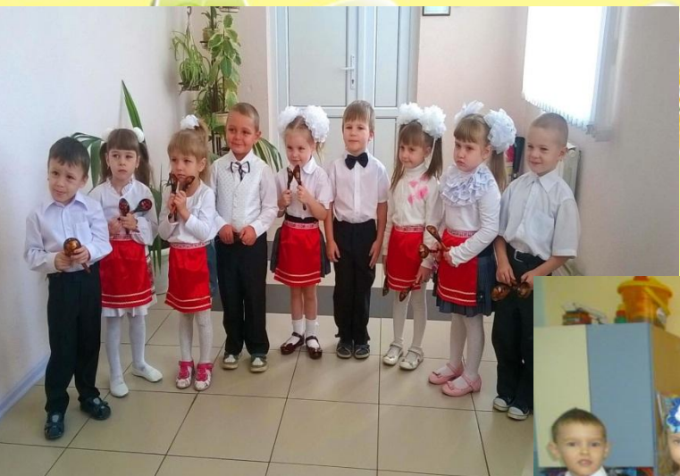
Выступление на празднике, посвященном Дню пожилых людей, проводимого в Воскресной школе – танец с ложками «Барыня»