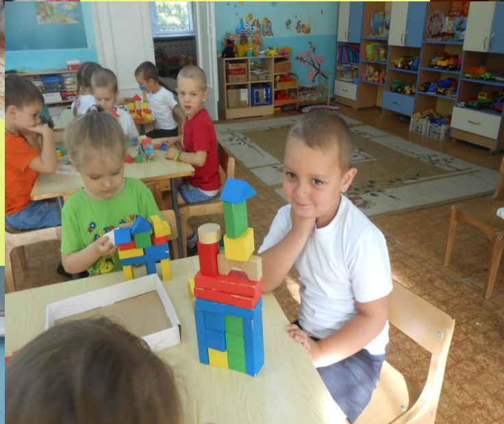
НОД «Дома в моём городе» (конструирование)