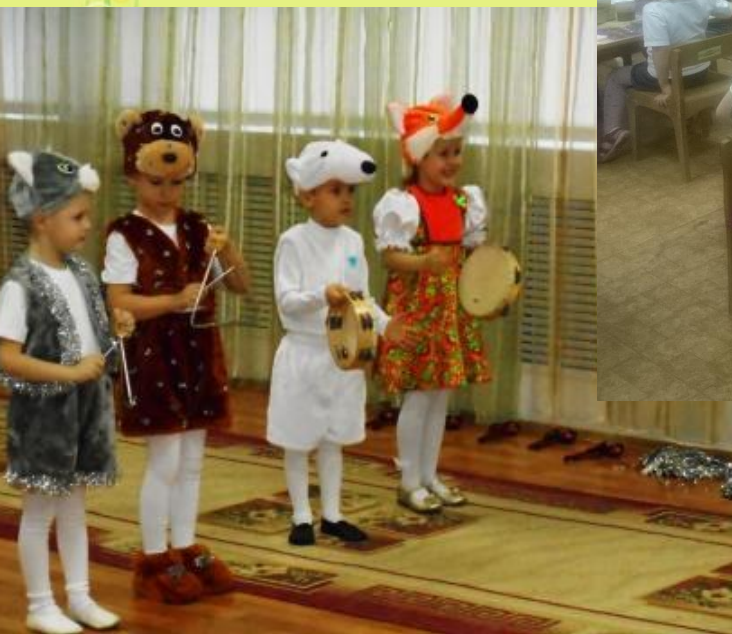
Игра на музыкальных инструментах на утреннике «Здравствуй, Новый год»