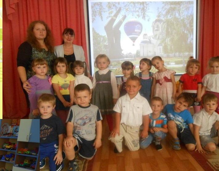
Мы с детьми на празднике Дня города Россoshь в нашем детском саду