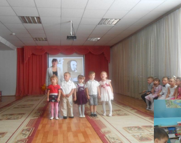
Дети читают стихи россoshанской поэтессы Р. Е. Дерикот из книги «Маленькие баечки бабушки Раечки»