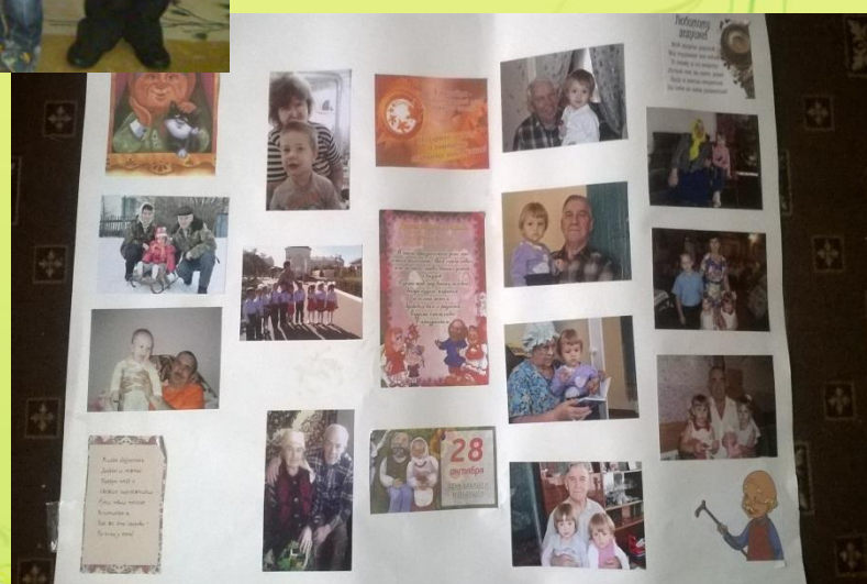
Изготовление стенгазеты «Бабушка рядышком с дедушкой»