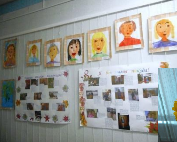
Газеты «Моя милая мамочка» - на которой всё не поместилось, мы сделали веер. Рядом с фотографией мамы – рассказ о ней