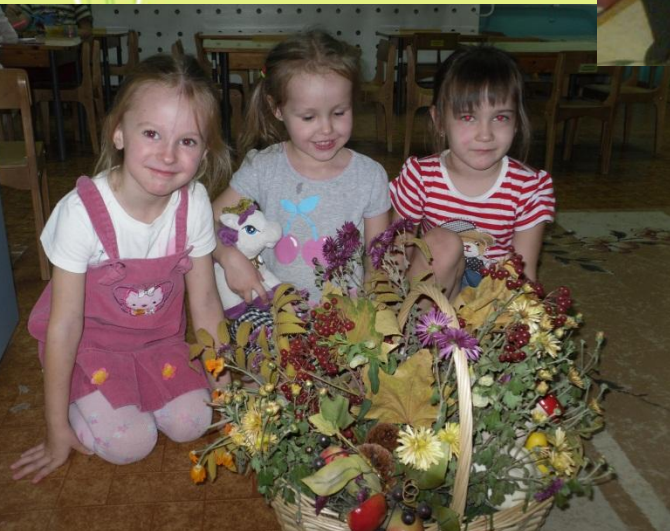
Конкурс поделок из природного материала «Осенний букет» номинация «Лучшая»