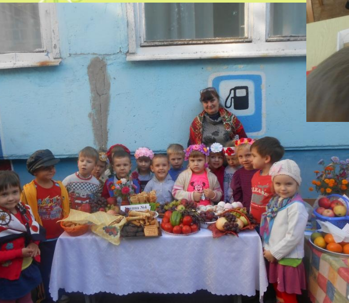
Мы с детьми на Русской Ярмарке, проводимой в нашем ДОУ