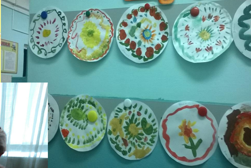
НОД «Украсим тарелочку» (свободное рисование)