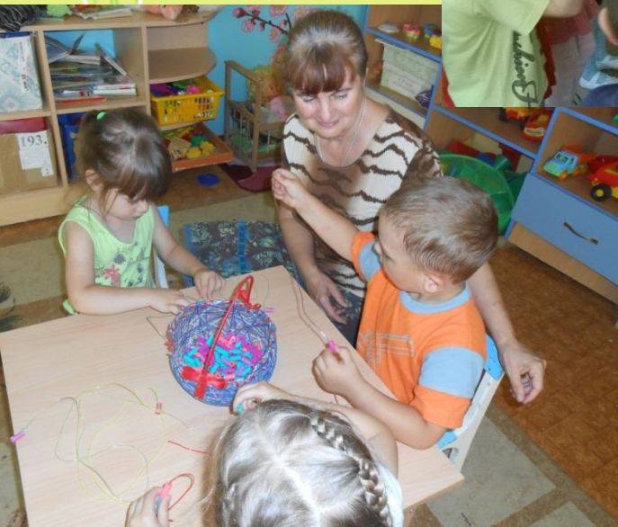
Дидактическая игра «Бусы для мамочки»