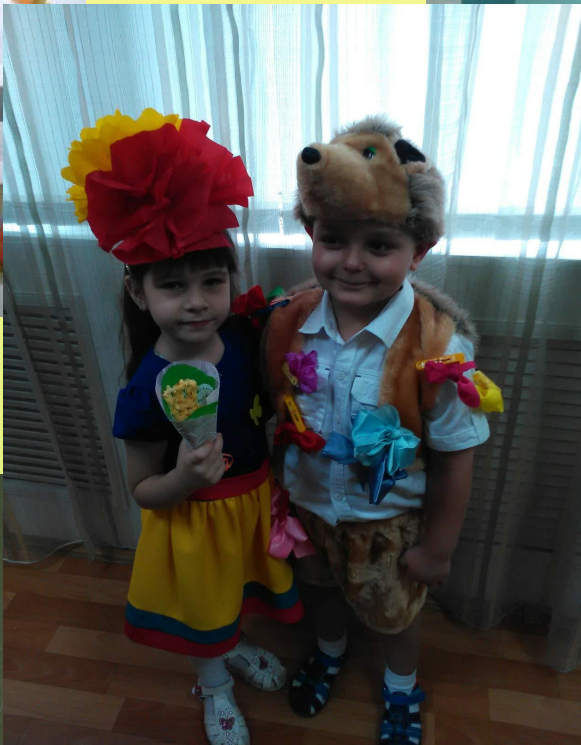
Инсценировка сказки «Ёжик и подарок для мамы». В руках у детей букеты, изготовленные собственными руками. Вместо цветка в серединке – бумажная детская ладошка