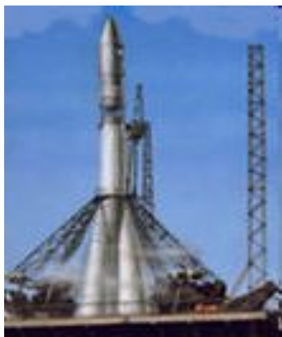
Ракета-носитель «Восток» - 1