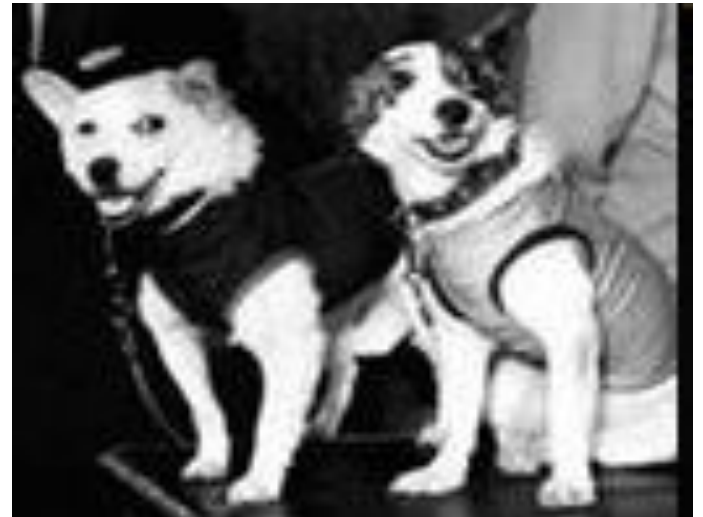
Белка и Стрелка