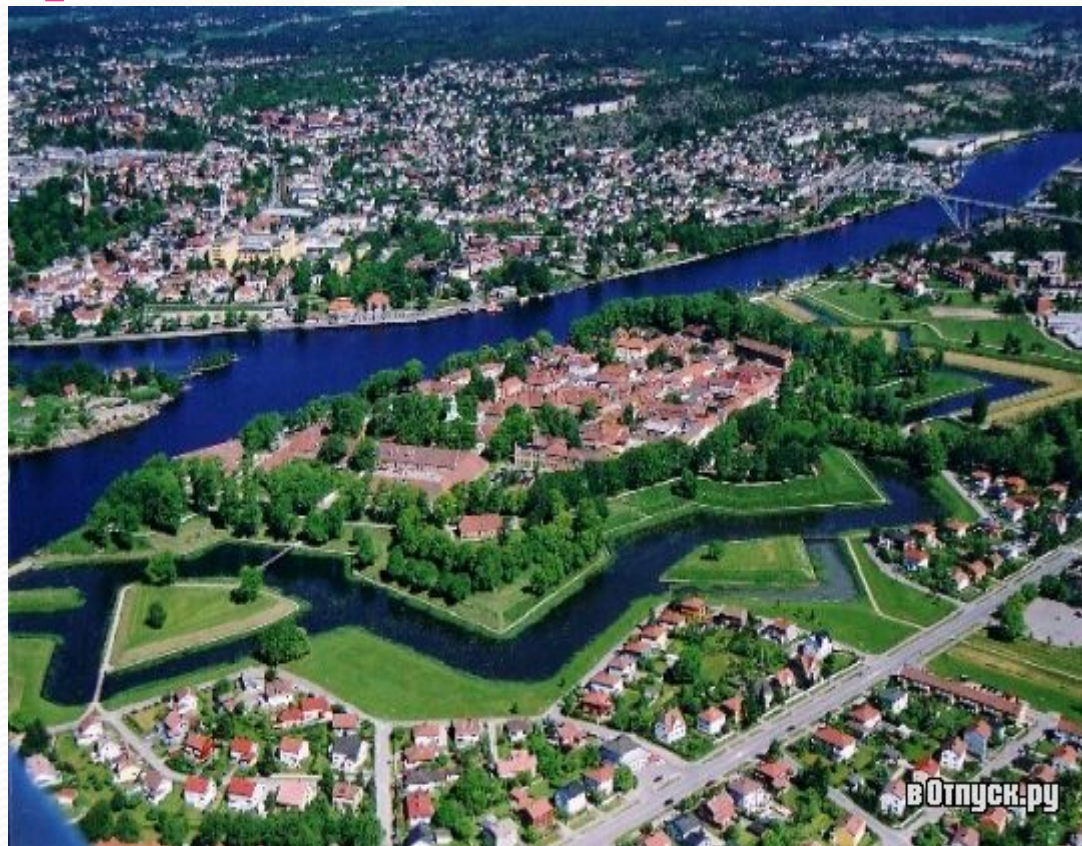
Крепость Фредрикстад (Фредрикстад)