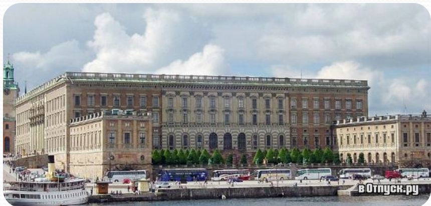
Королевский дворец (Стокгольм)