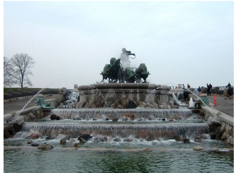
Фонтан Гефион (Копенгаген)