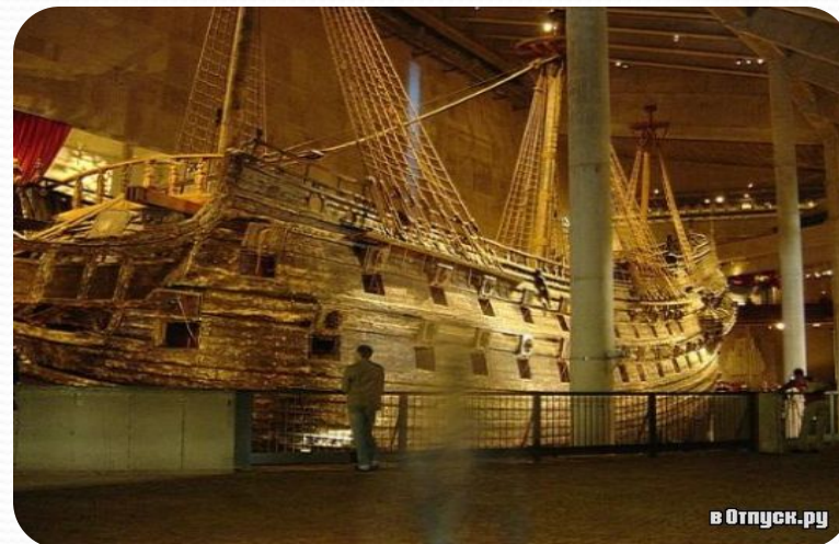
Корабль-музей Васа (Стокгольм)