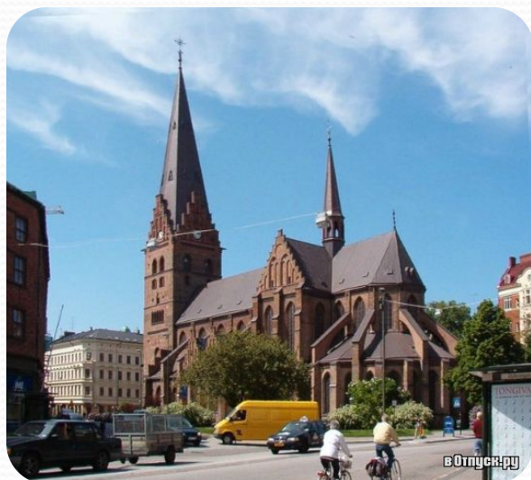
Церковь Св. Петра (Мальмё)