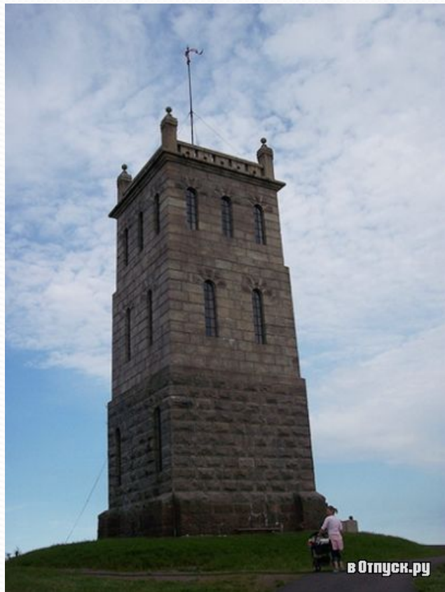
Замковая гора (Тёнсберг)