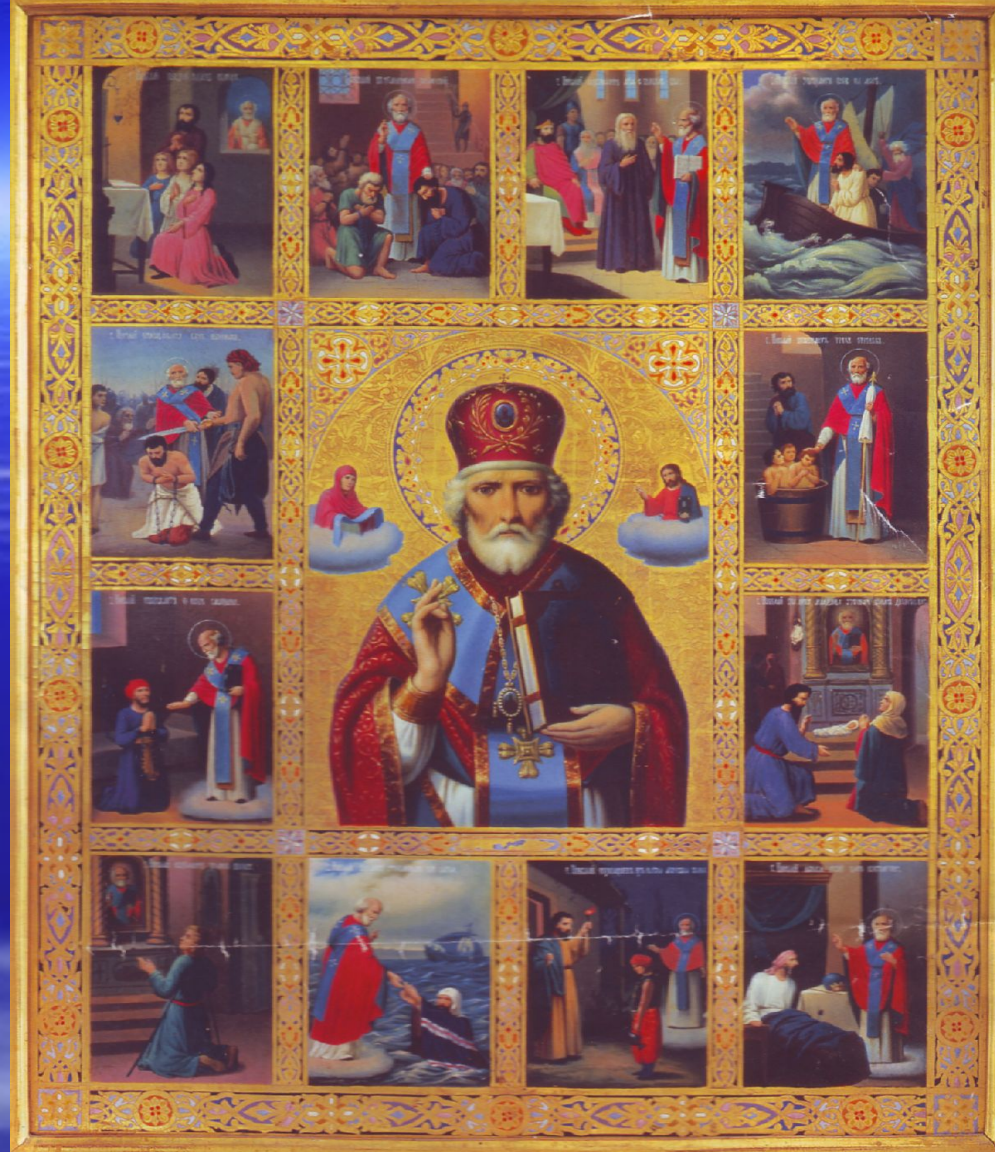
Святитель и Чудотворец Николай Мирликийский С ЖИТИЯМИ