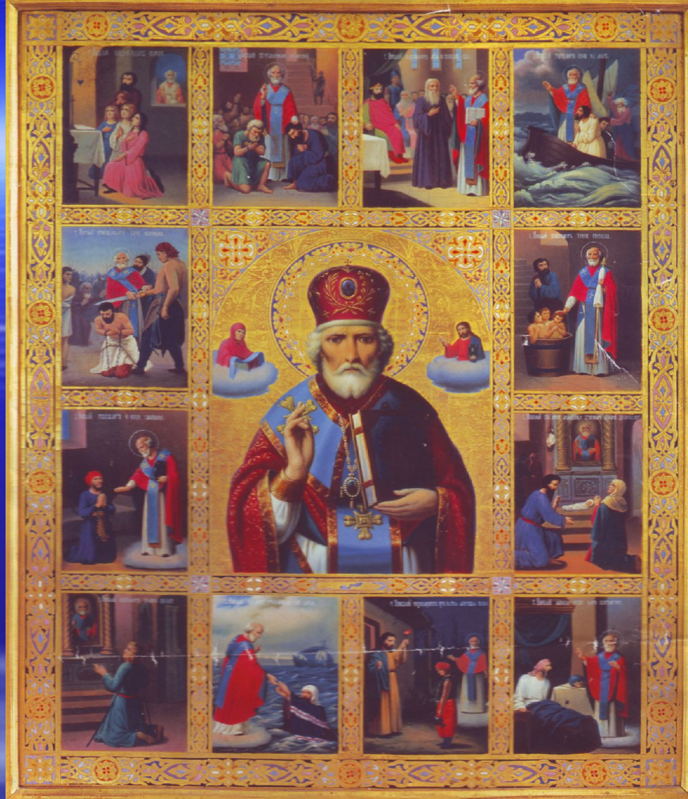
Святитель и Чудотворец Николай Мирликийский С ЖИТИЯМИ