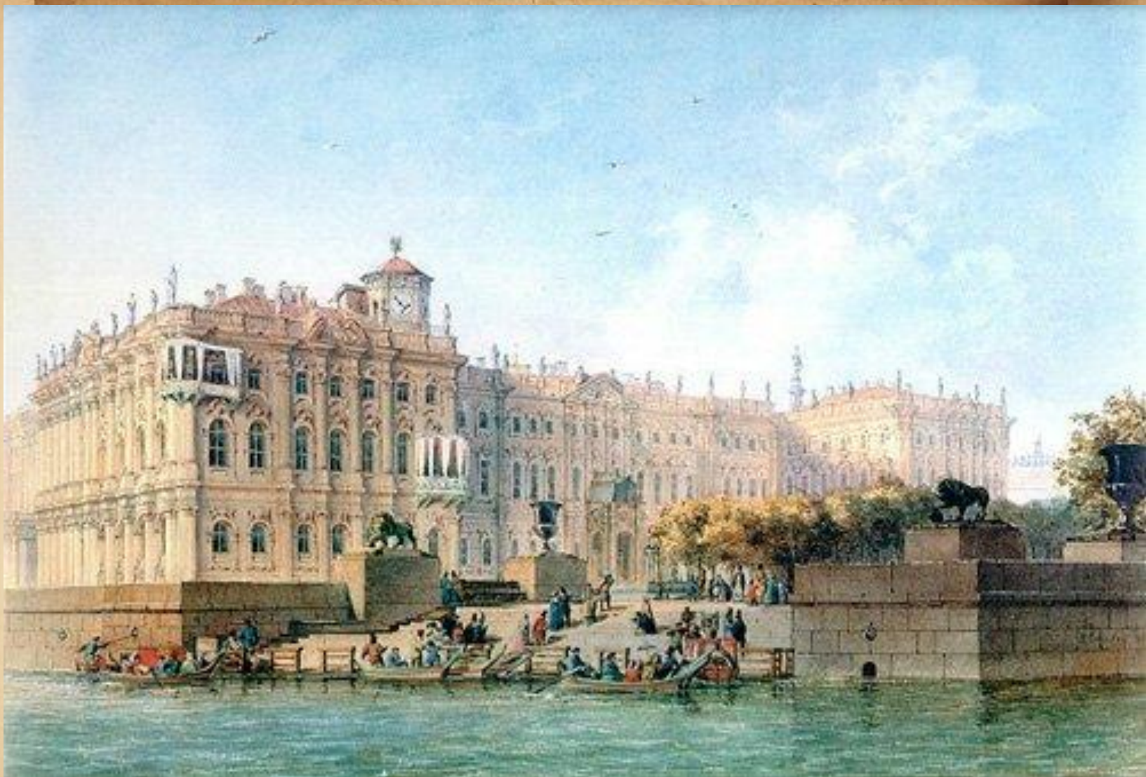
В. С. Садовников. Вид Зимнего дворца с запада. 1840 г.