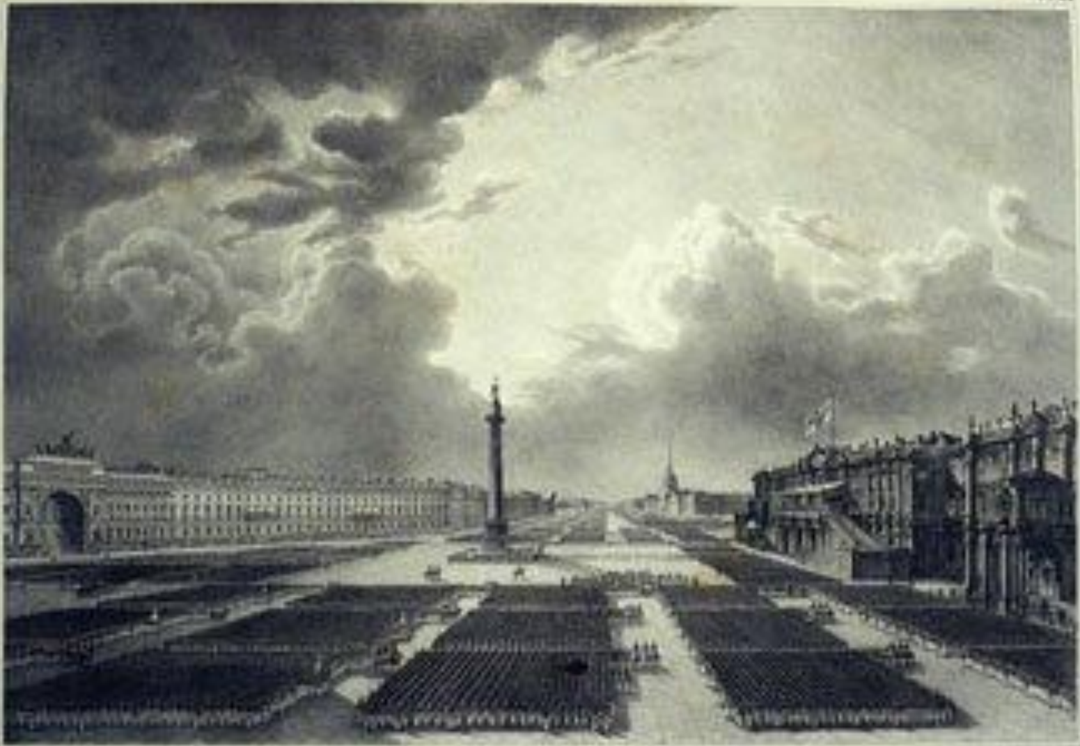
Дворцовая площадь. Смотр войск