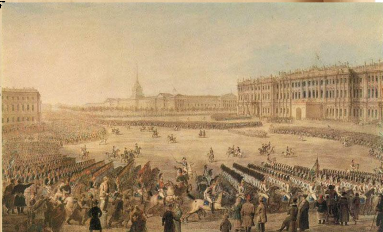
"Парад на Дворцовой площади 19 марта 1816 года".

На Дворцовую площад выходят фасады (наружная сторона здания) нескольких зданий. Среди них Зимний дворец.