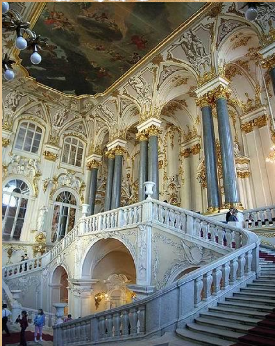
Парадная лестница Зимнего дворца