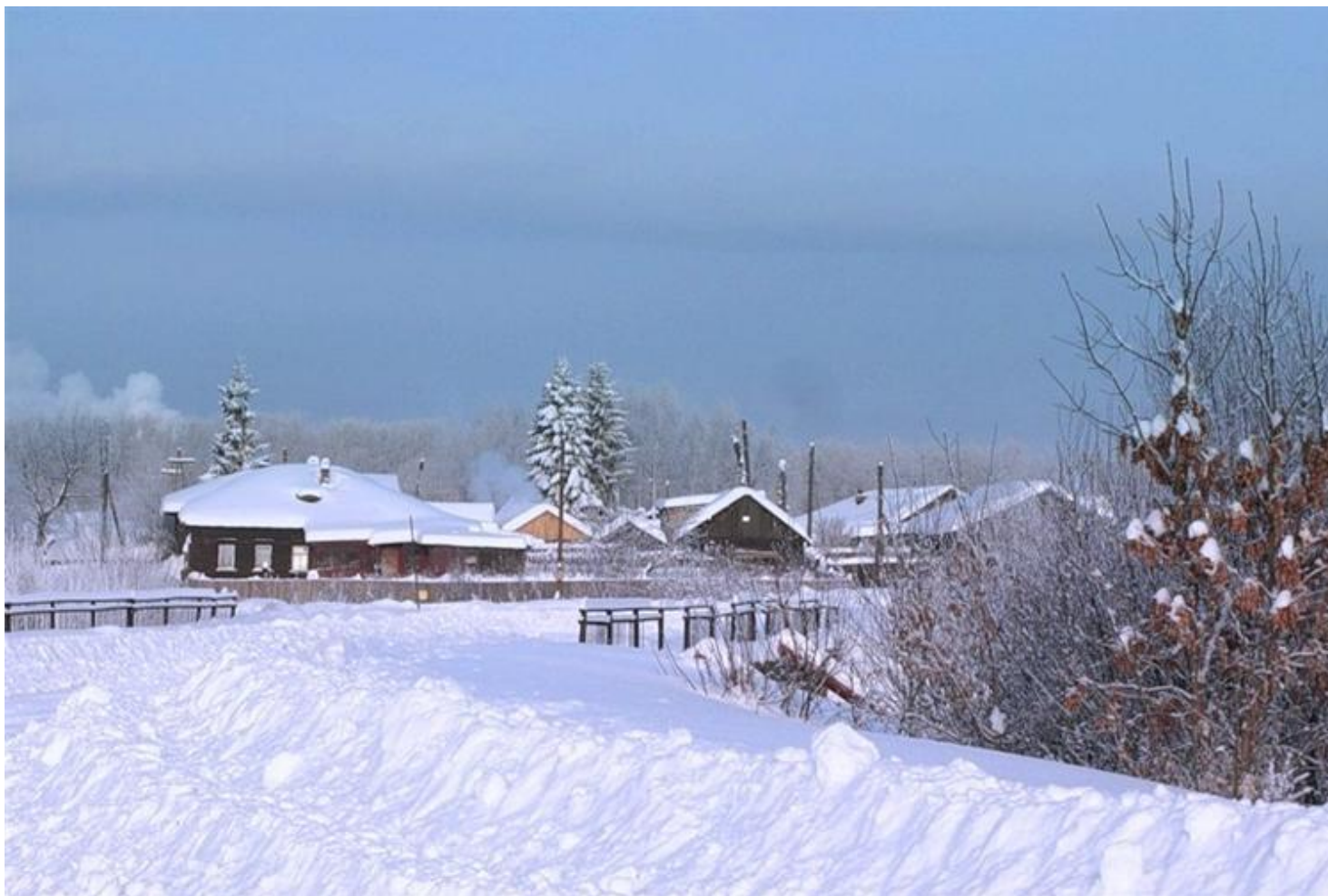
Дымковская слободка сегодня.