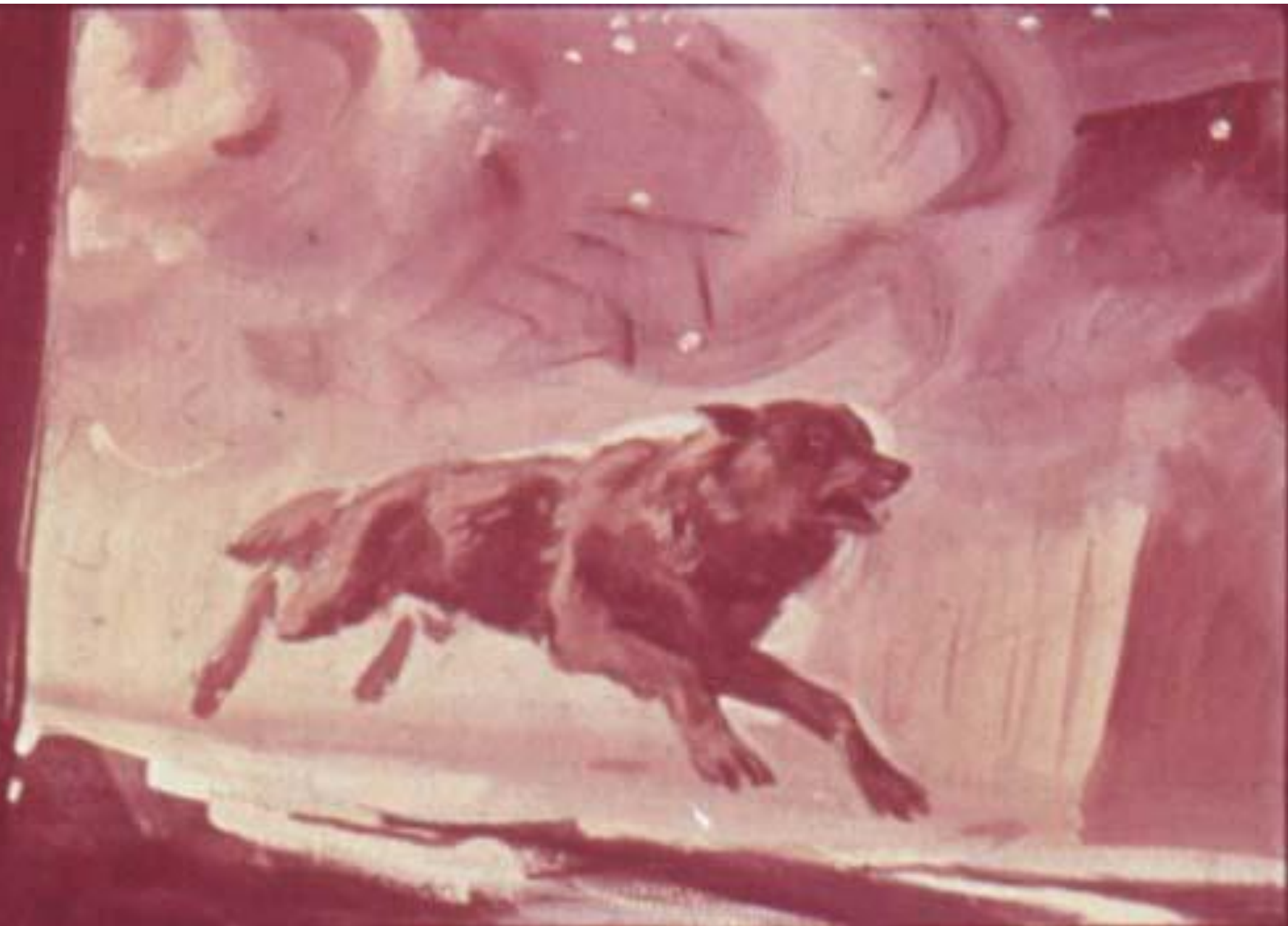
Он мигом выскочил из окна, а за ним и Единственный.