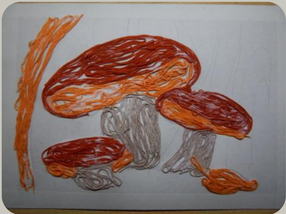
Образец работы. Видеоурок.