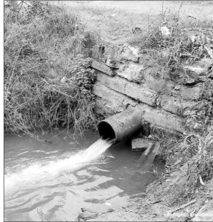
■ Загрязнение окружающей среды отходами производства карается большими штрафами.

В прошлом году Управлением было выявлено 225 нарушений федерального природоохранного законодательства, из которых 164 были устранены. Инспекторами выдано 113 предписаний, доля выполнения составила 86,7 процента.