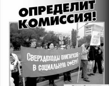
Митинг в Невинномыске