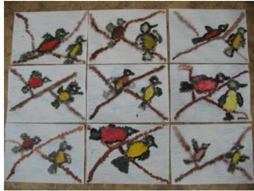
«Снегири и синицы на ветках»