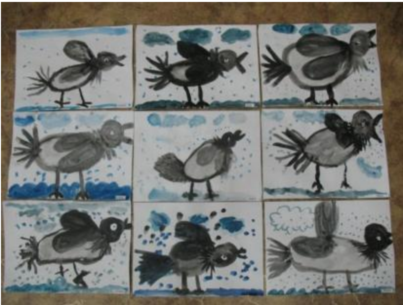
Рисование на тему: «Серая ворона»