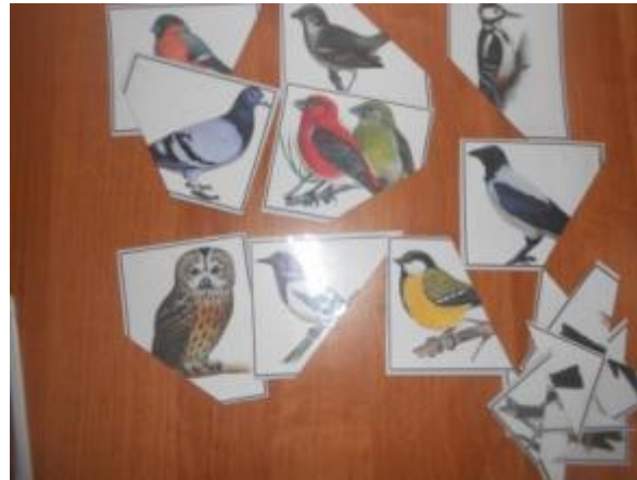
Дидактическая игра «Чей хвост?»