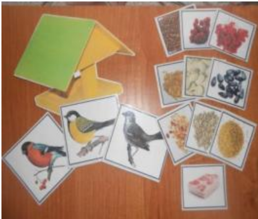
Дидактическая игра «Птичья столовая»