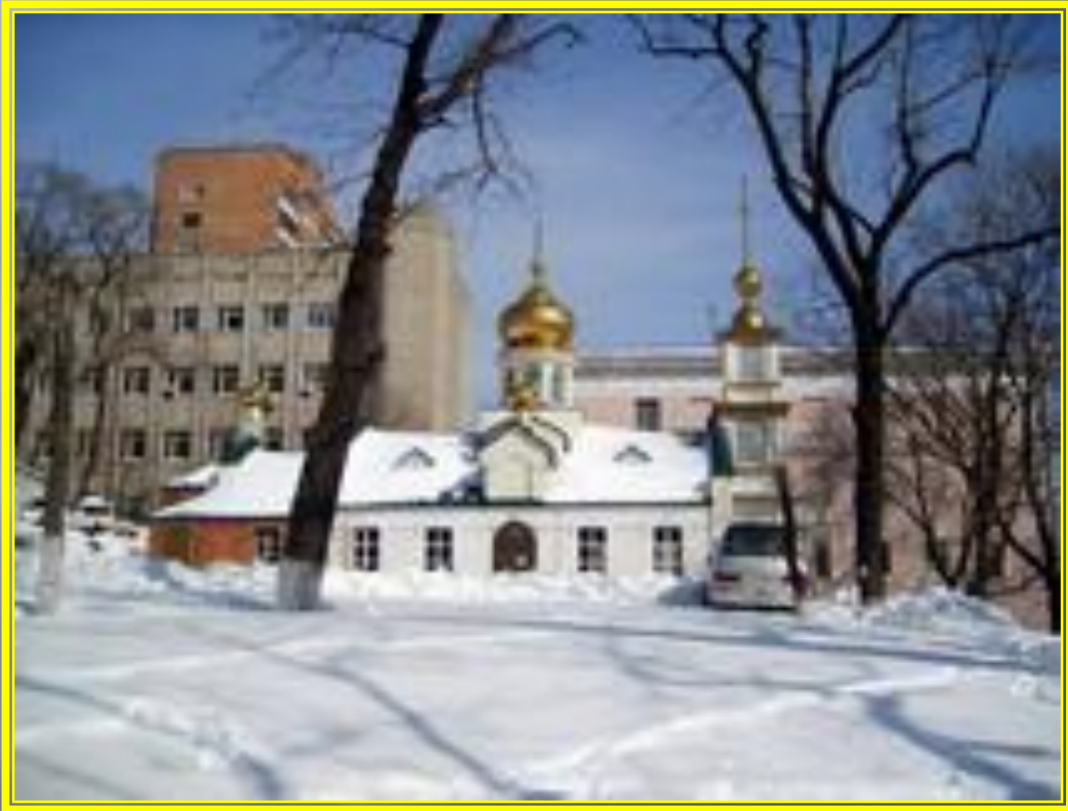
г.Владивосток, ул. Светланская, 65 ост. Лазо