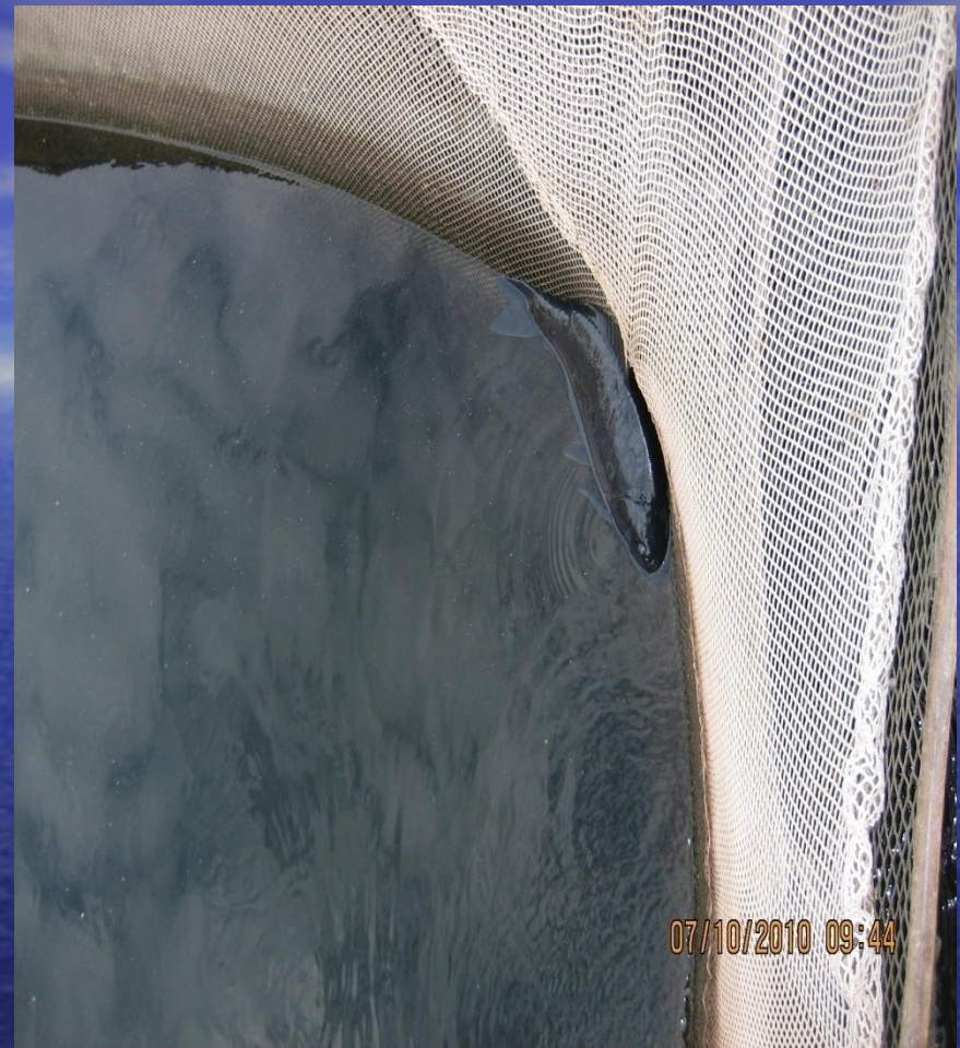
Любопытный карп запутался в садке