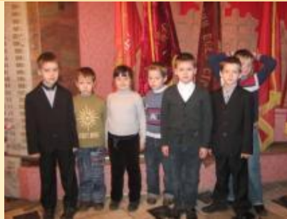
Посещение музея МЧС