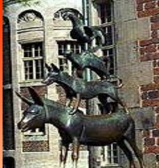
ПАМЯТНИК БРЕМЕНСКИМ МУЗЫКАНТАМ