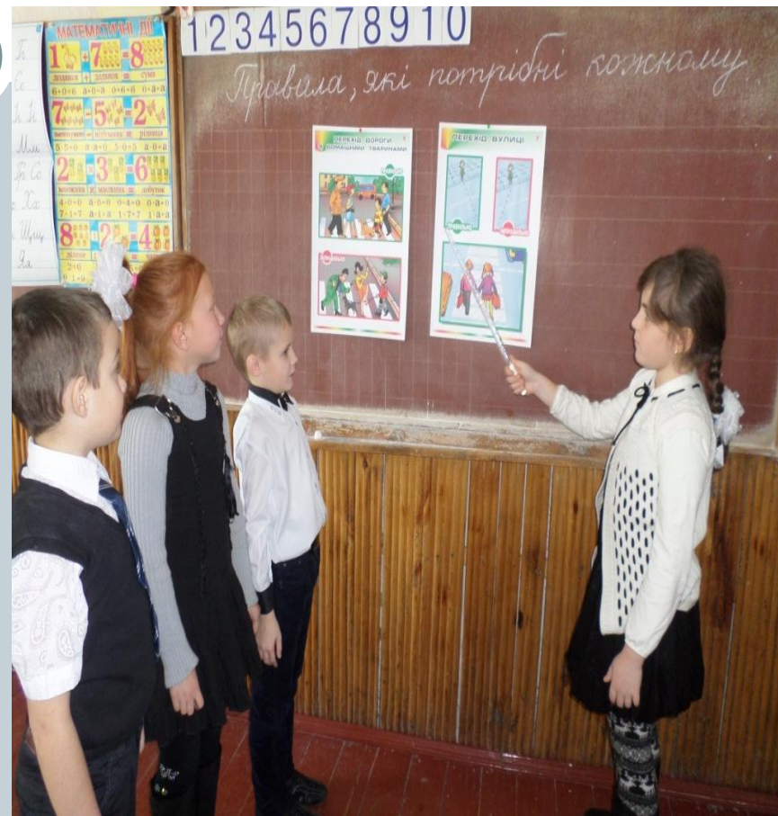
Проект “Правила, які потрібні кожному”