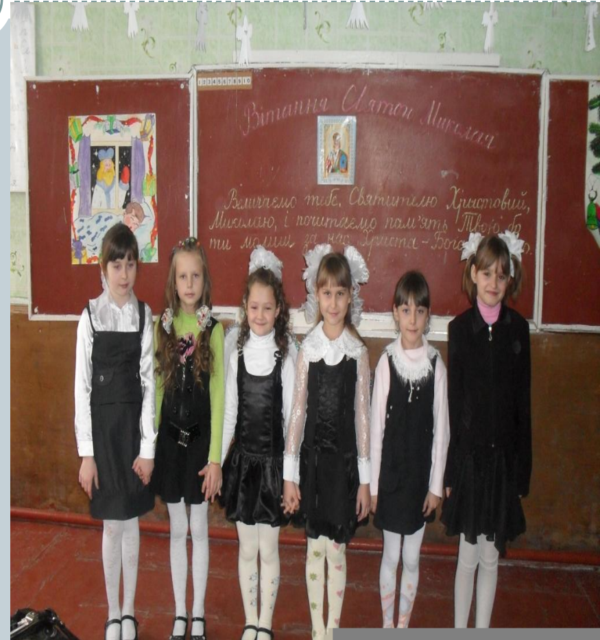
Проект “Життя Святого Миколая”