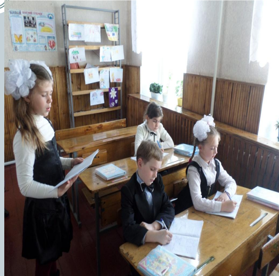
“Ажурна міні - пилка”