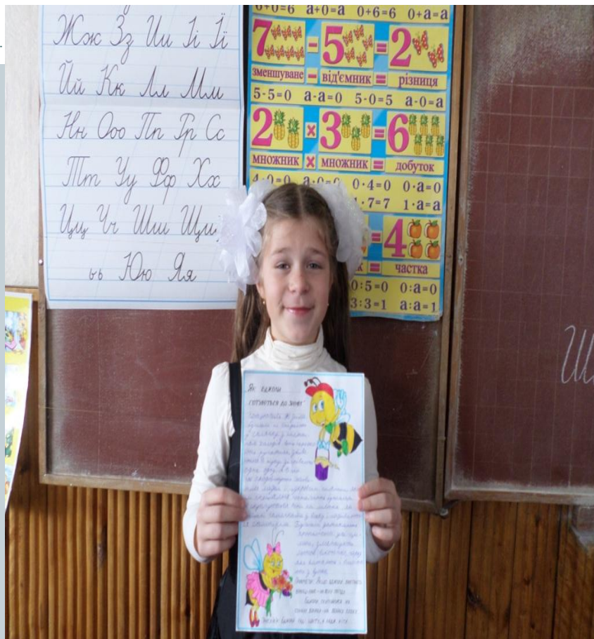
Міні- проект “Як бджоли готуються до зими”