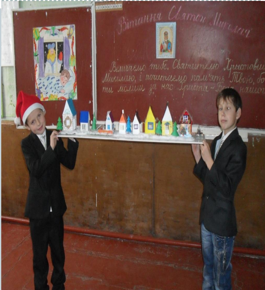
Творчий проект “Будиночок моєї мрії”

До школи приходять діти, які живуть в інформаційному суспільстві, цифровому середовищі, і щоб скористатися його перевагами, використовую проектну діяльність .