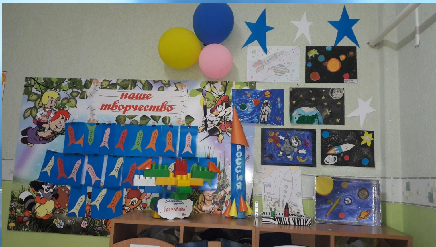
Наша Галактика 9 группы