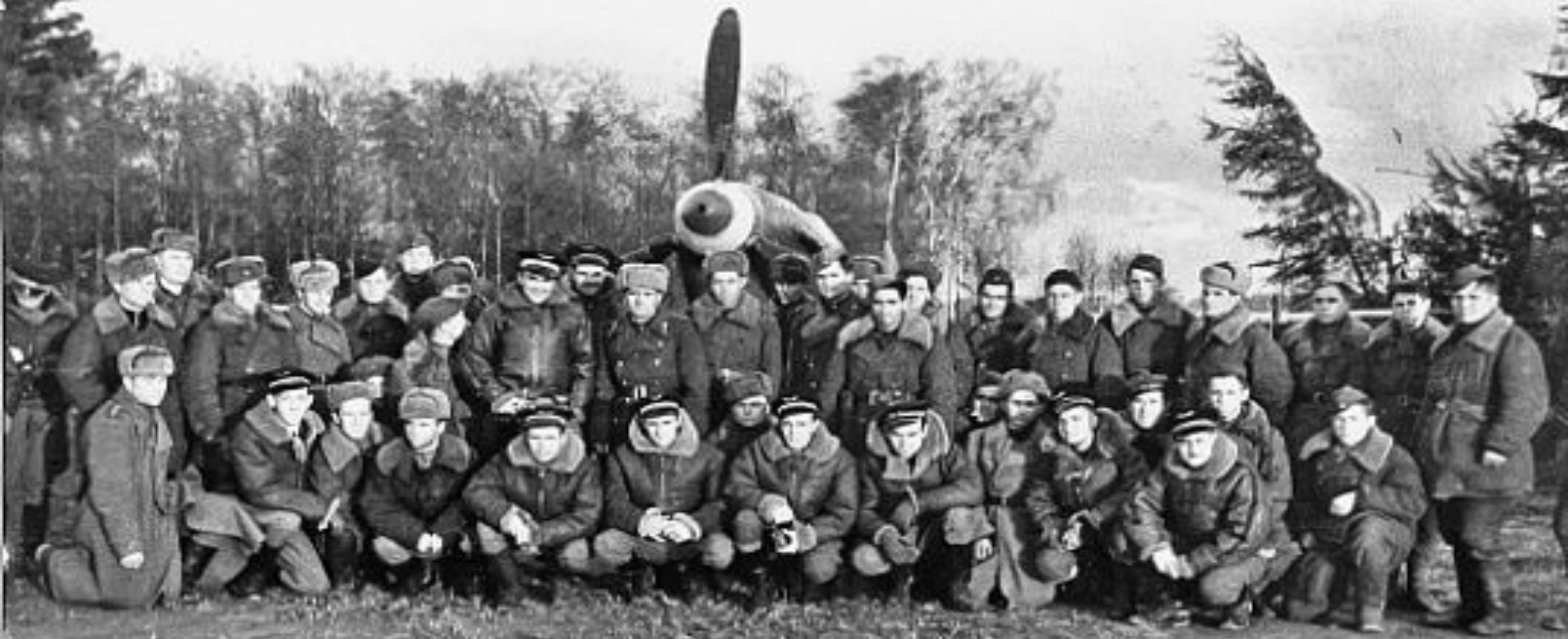
НОРМАНДИЯ — НЕМАН — ФРАНЦУЗСКИЙ ИСТРЕБИТЕЛЬНЫЙ АВИАЦИОННЫЙ ПОЛК ВОЕВАВШИЙ ВО ВРЕМЯ ВТОРОЙ МИРОВОЙ ВОЙНЫ ПРОТИВ ВОЙСК СТРАН ОСИ НА СОВЕТСКО-ГЕРМАНСКОМ ФРОНТЕ В 1943—1945 ГОДАХ.