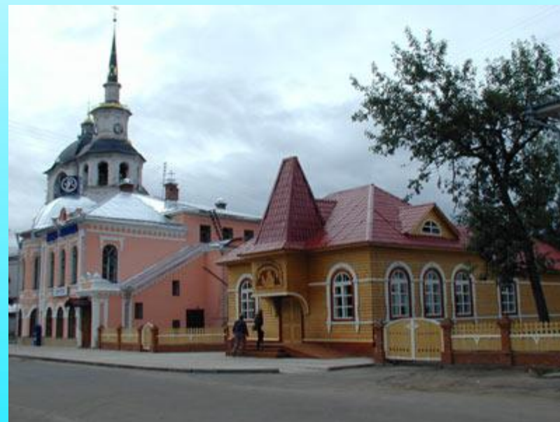
Почта Деда Мороза