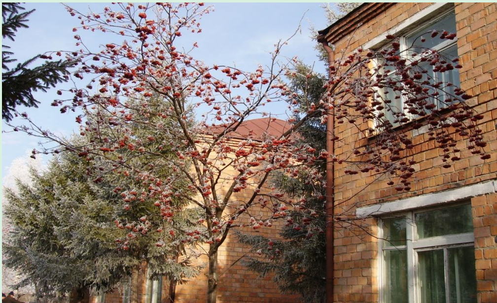
Районная базовая площадка на базе МБДОУ № 8