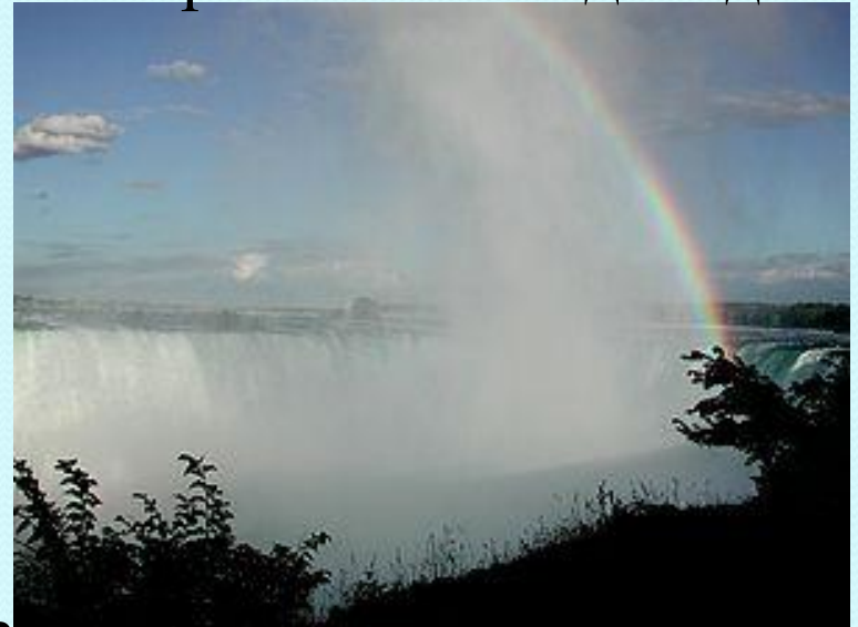
3. Водопад «Подкова»