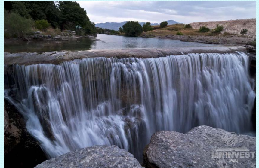
2. Американский водопад