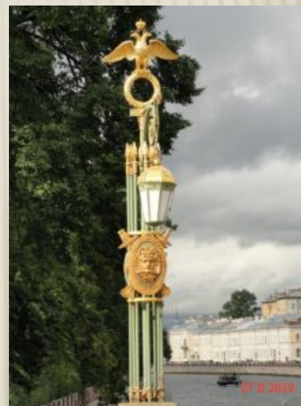
Мост Ломоносова Старо-Калинкин Пантелеймоновский