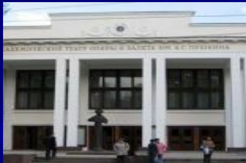
Театр оперы и балета имени Пушкина