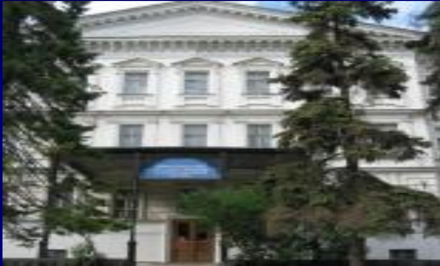
Государственный художественный музей