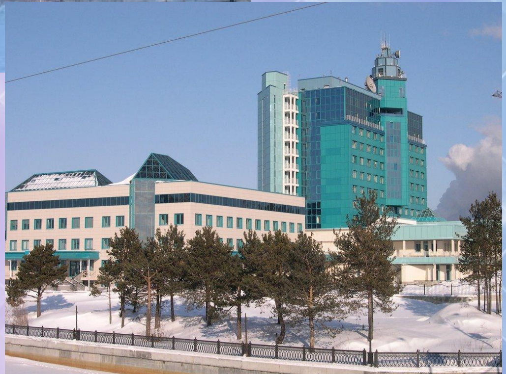
Здание «Газпром Трансгаз Сургут»