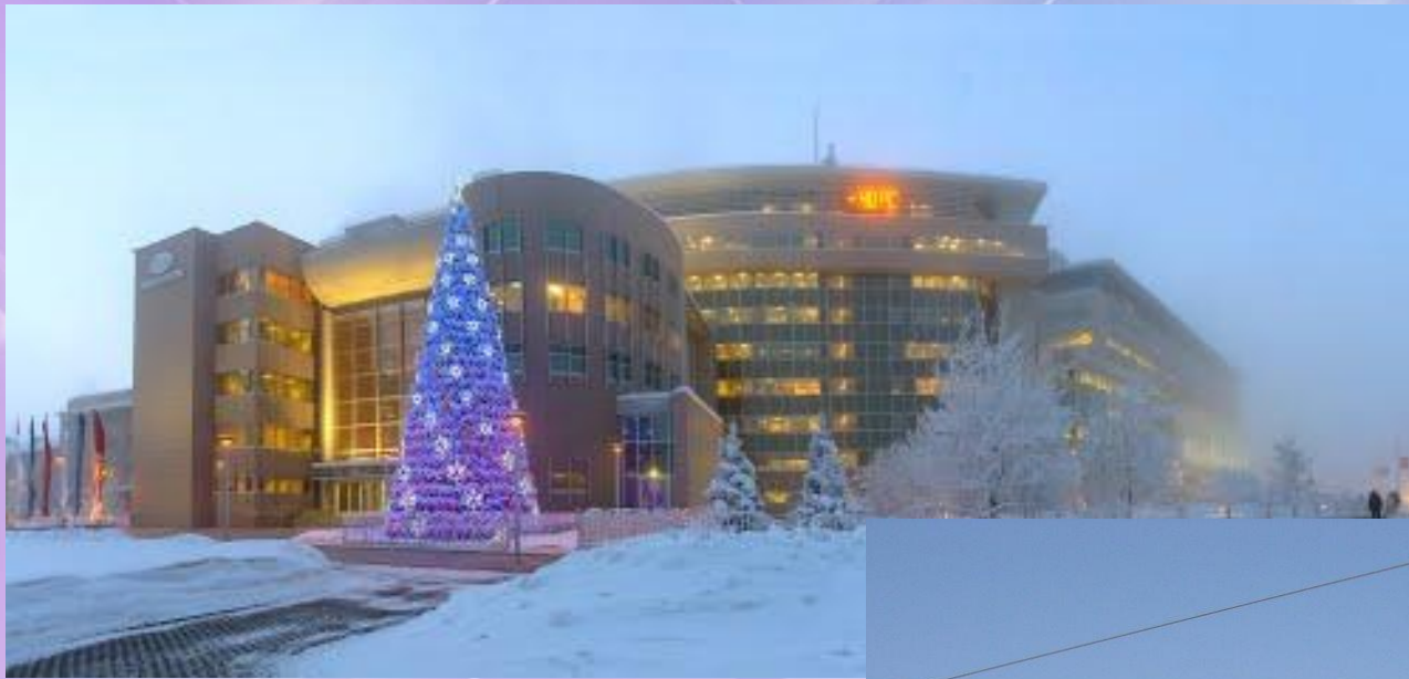
Здание Бизнес центра «Сургутнефтегаз»