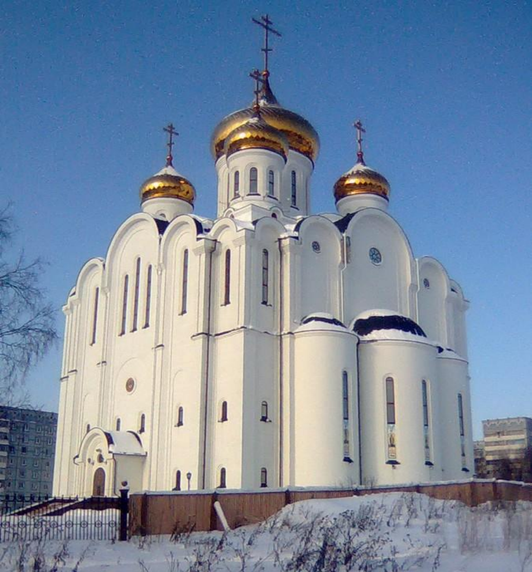
Свято-Стефановский Кафедральный собор