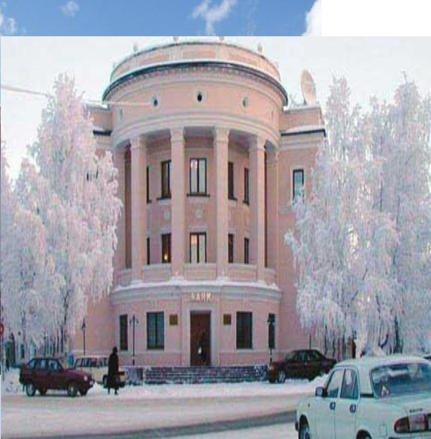
Архитектура города Ухта