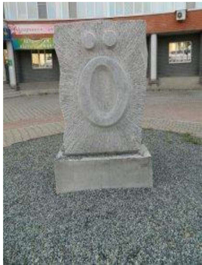
Памятник букве коми алфавита