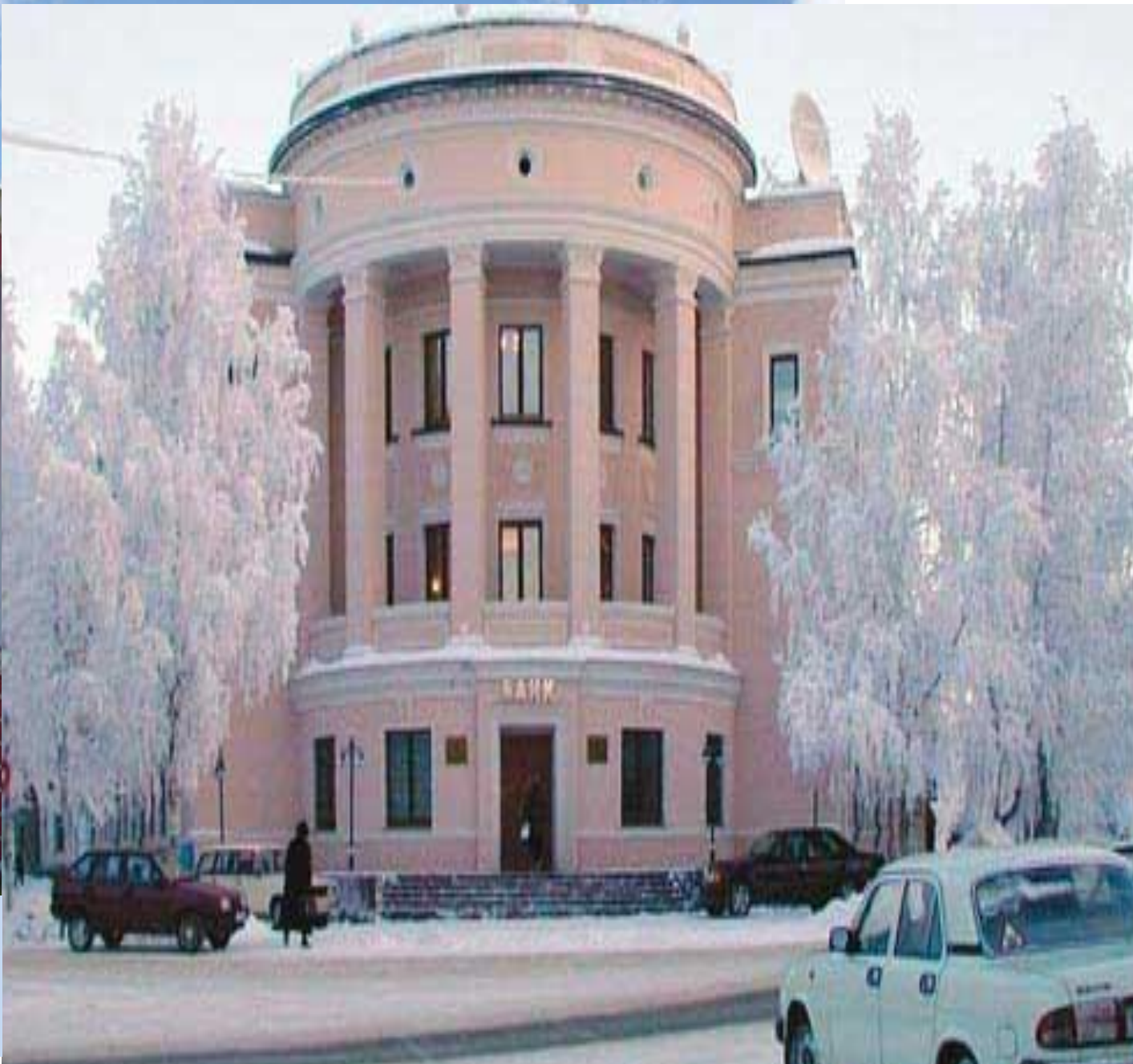
Архитектура города Ухта