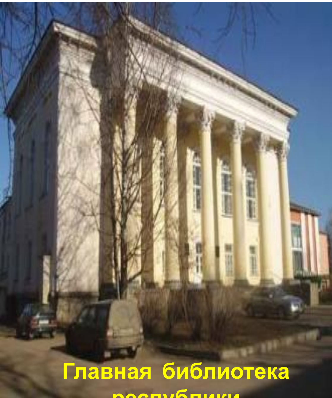
Главная библиотека республики