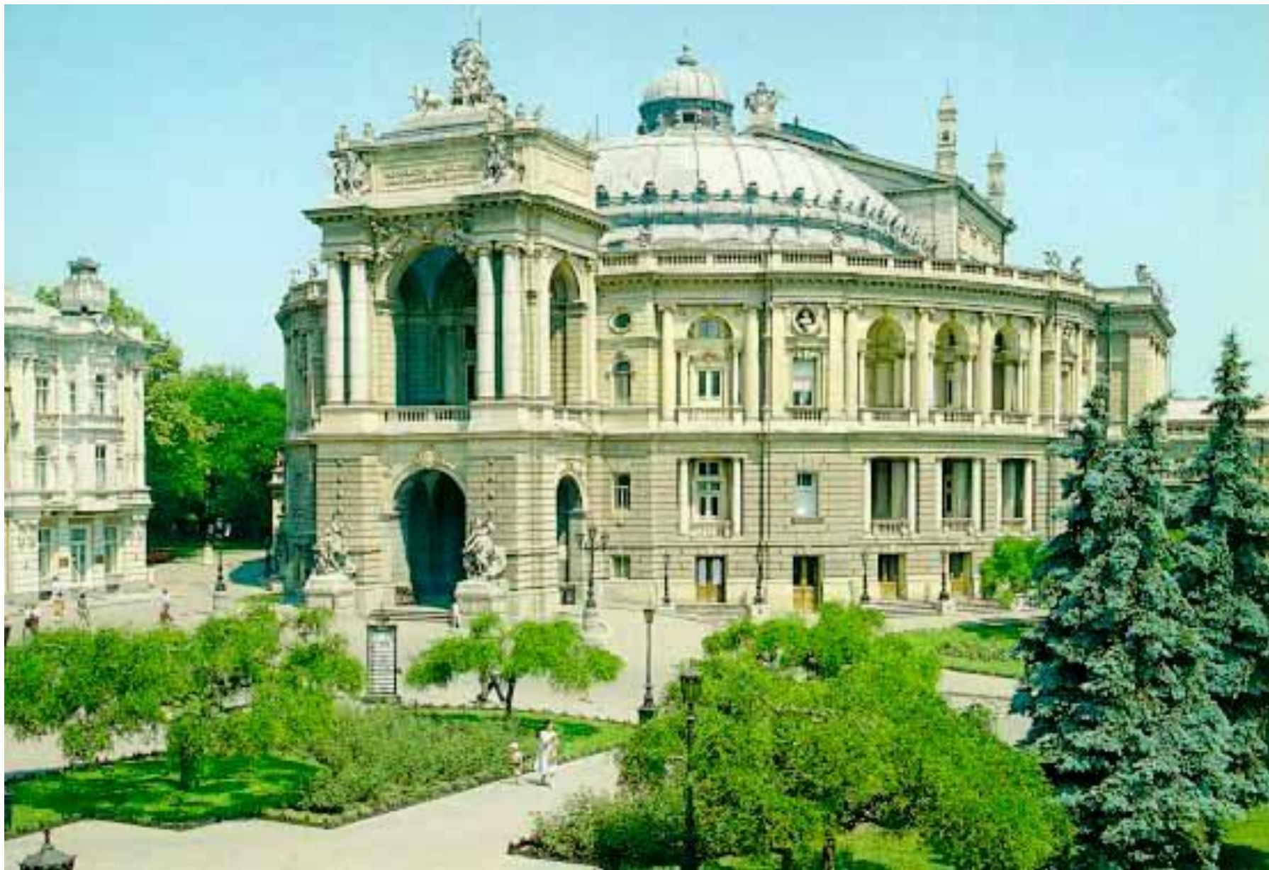
оперный театр в Одессе