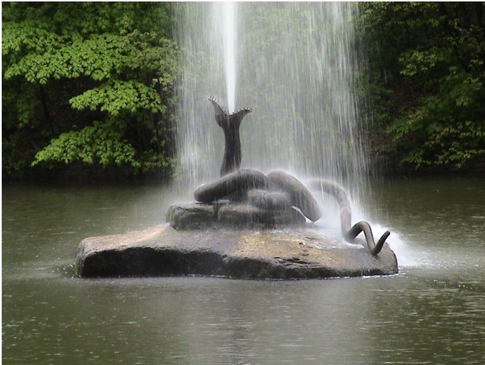
фонтан-змея в «Софиевке»