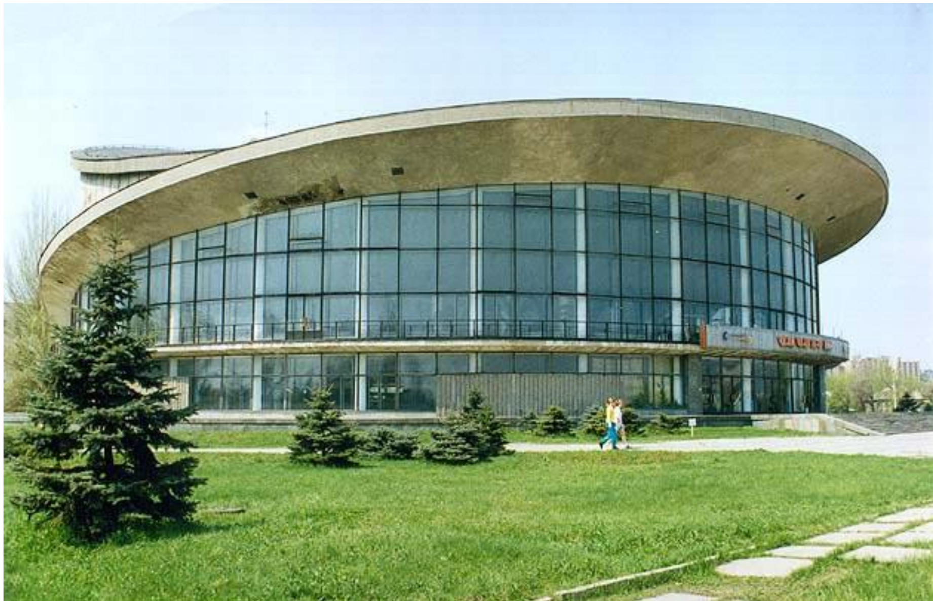
цирк в Луганске