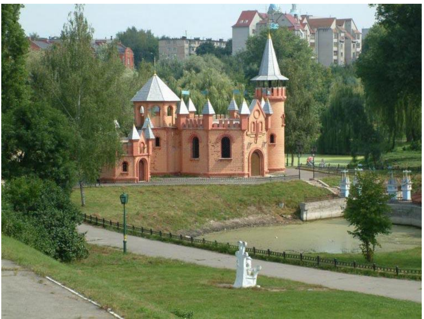
Детский парк и замок в г. Сумы