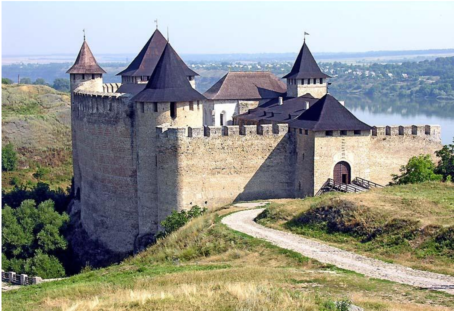
Хотинская крепость в Каменец-Подольском