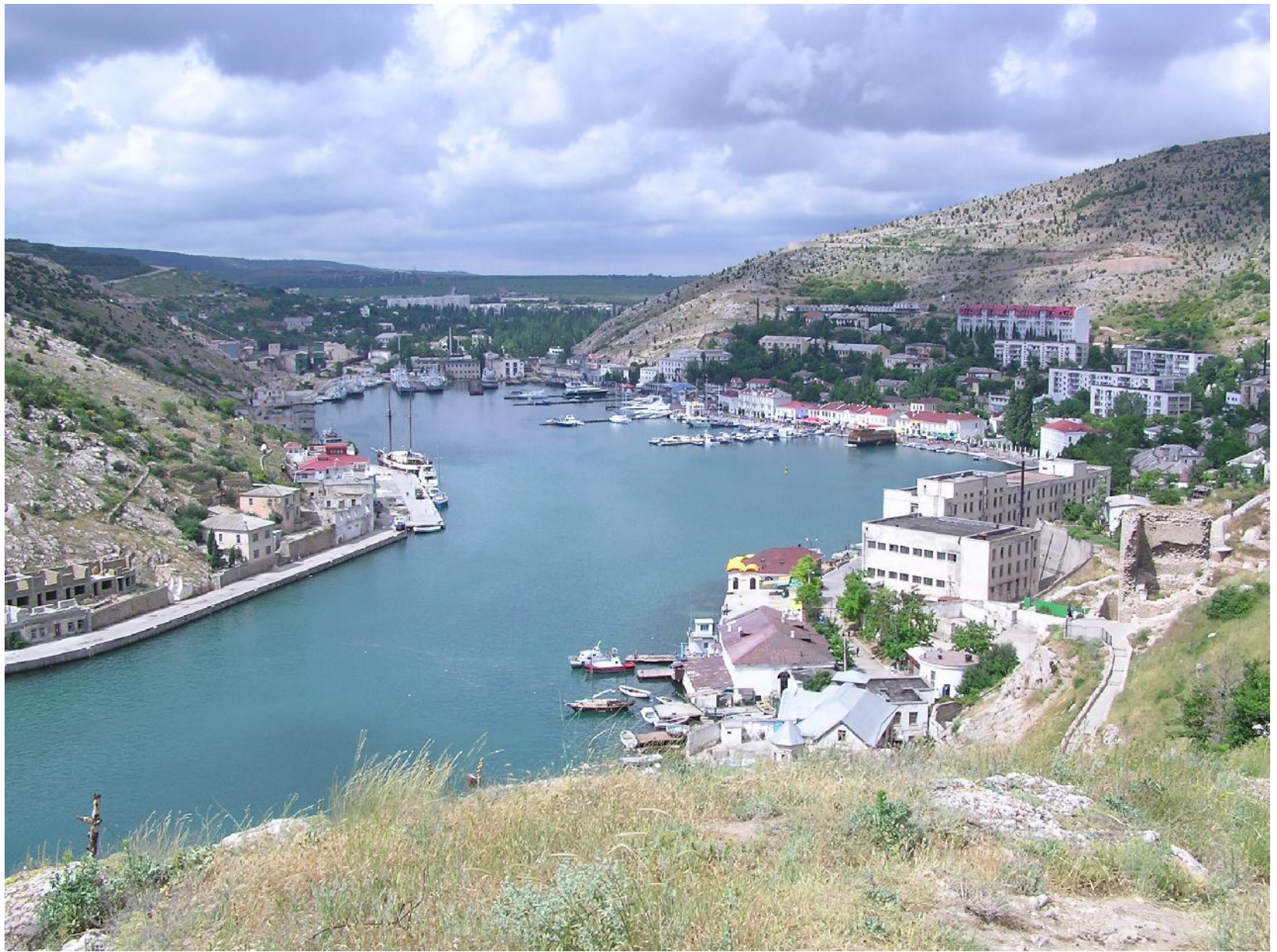
г. Балаклава, Крым