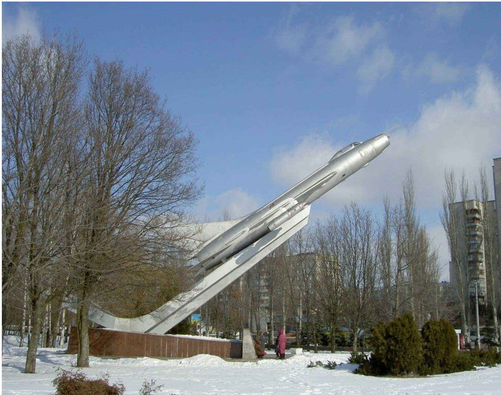
памятник воинам-освободителям в Черкассах