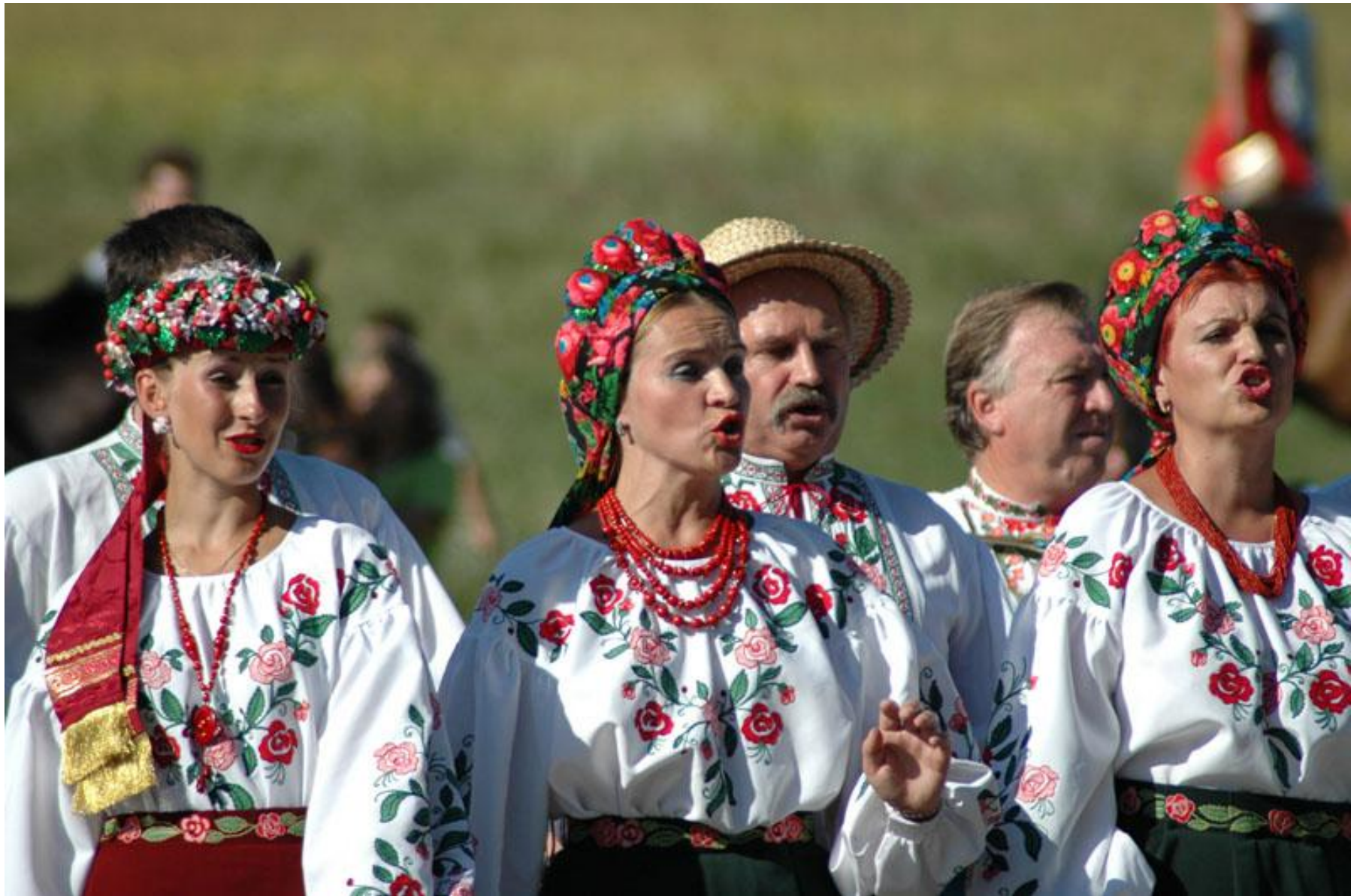
национальные украинские костюмы