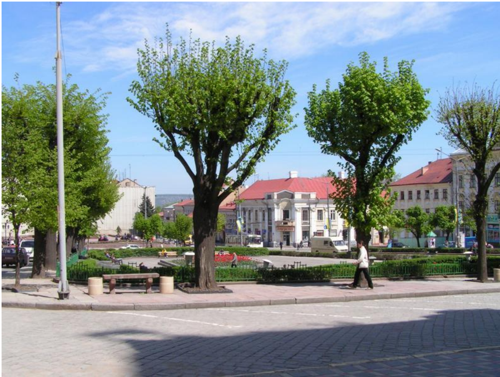
г. Черновцы, центральная площадь