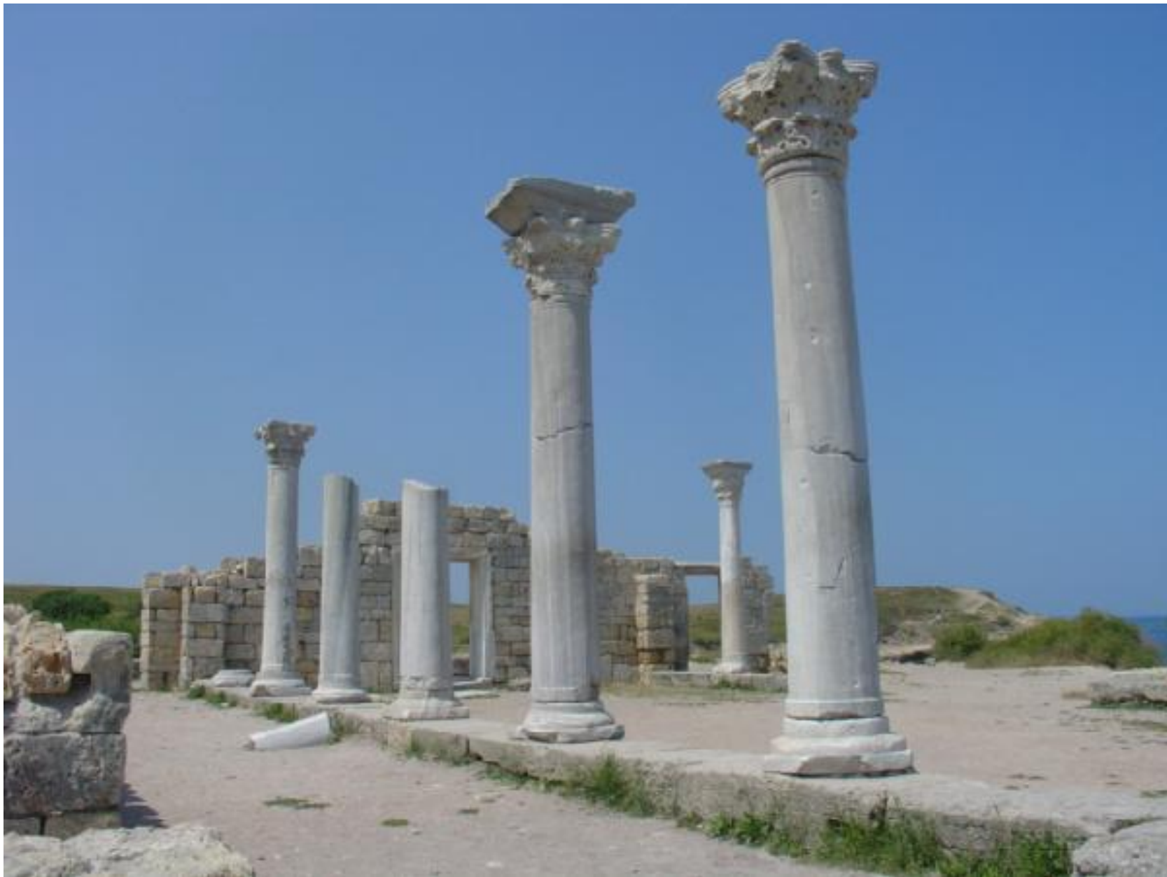
древние руины Херсонеса