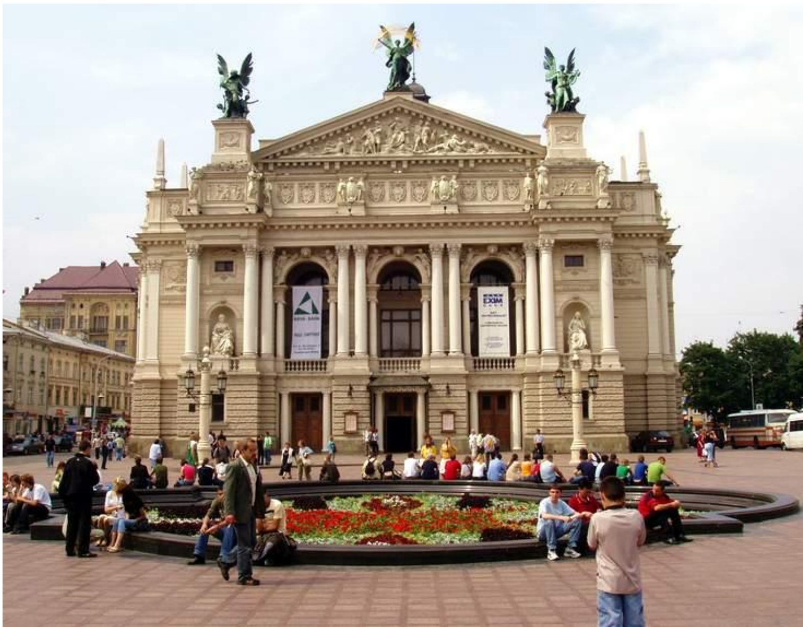
оперный театр во Львове