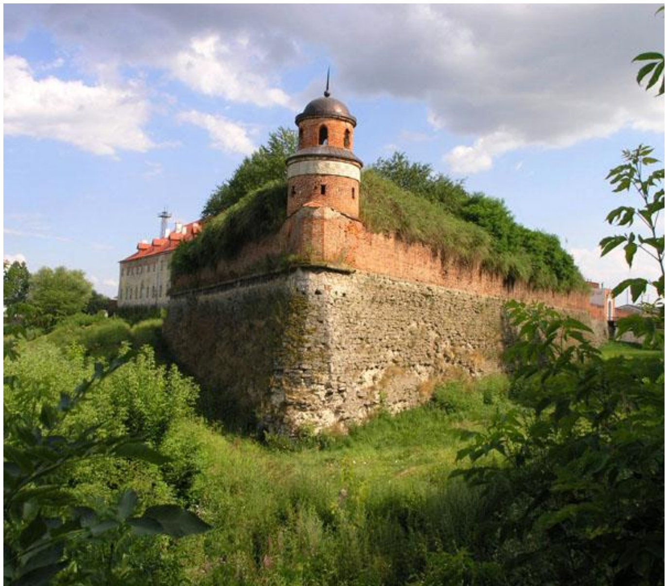
Бастион в Дубно, Ровенщина