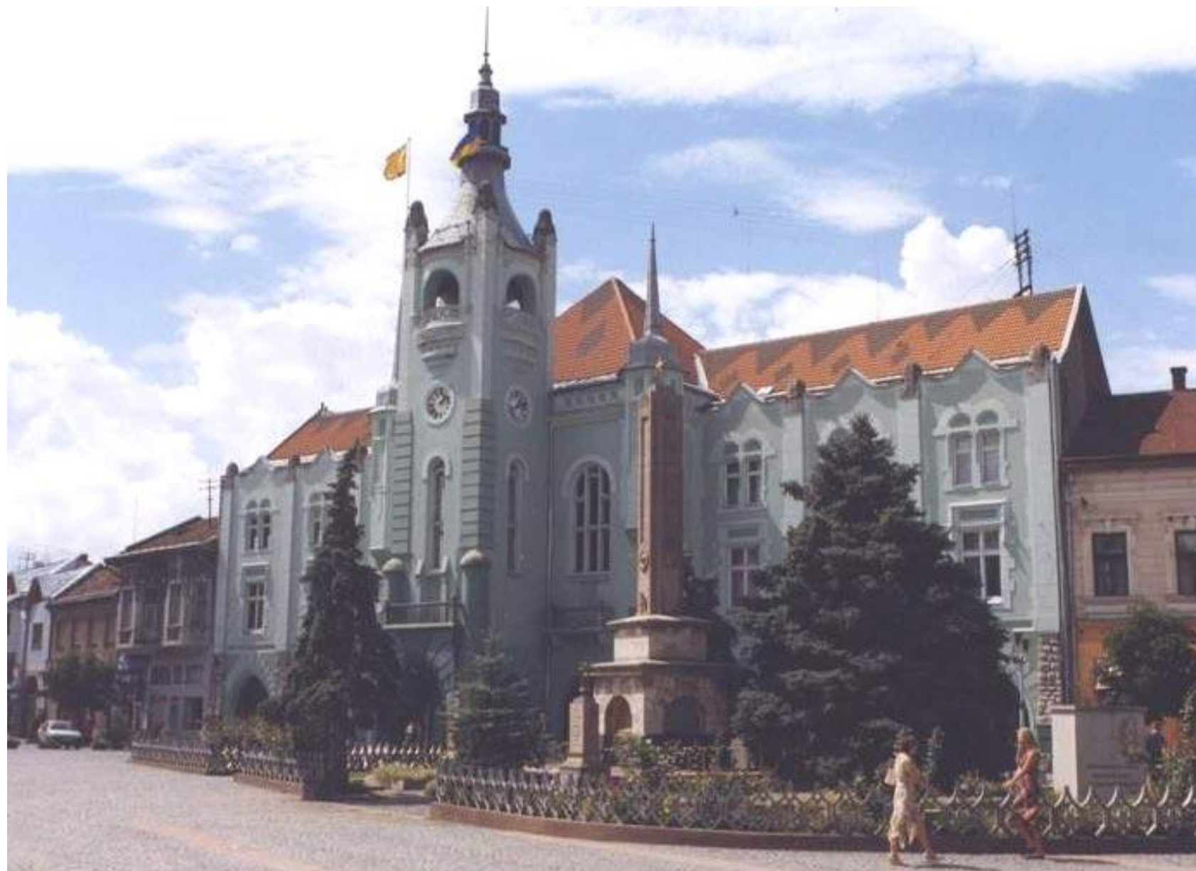
ратуша в г. Мукачево