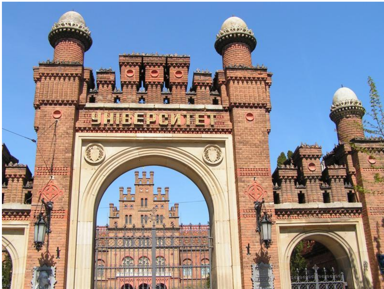
университет в Черновцах