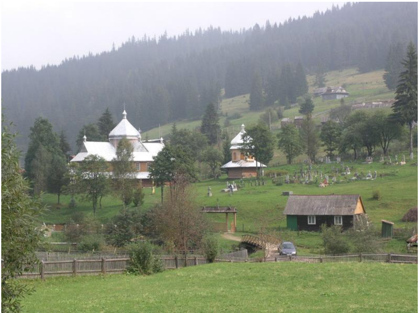
деревня в Карпатах