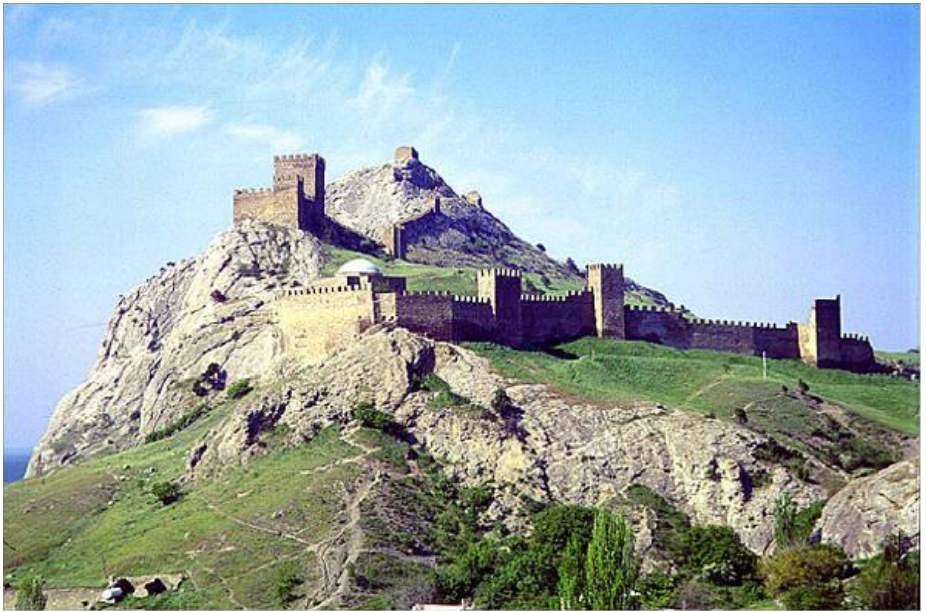
Генуэзская крепость, Судак, Крым