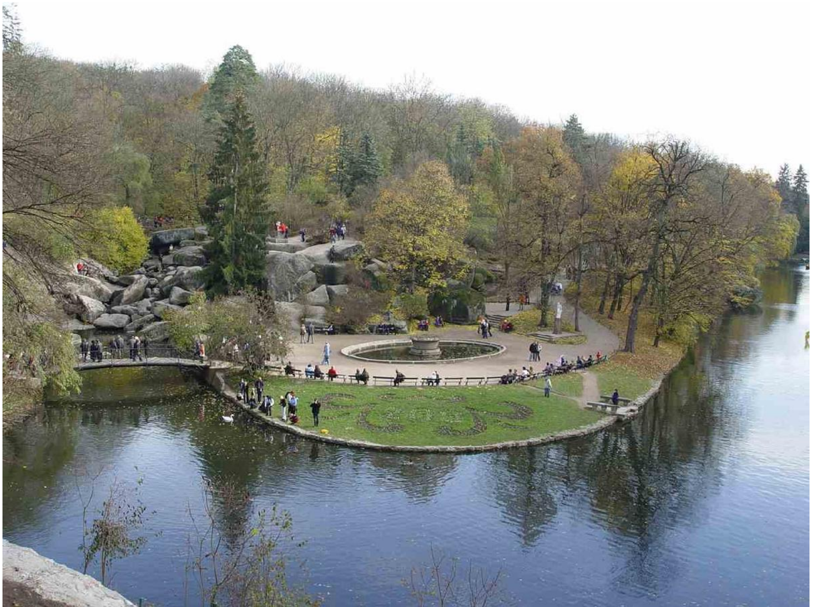
парк «Софиевка», Умань