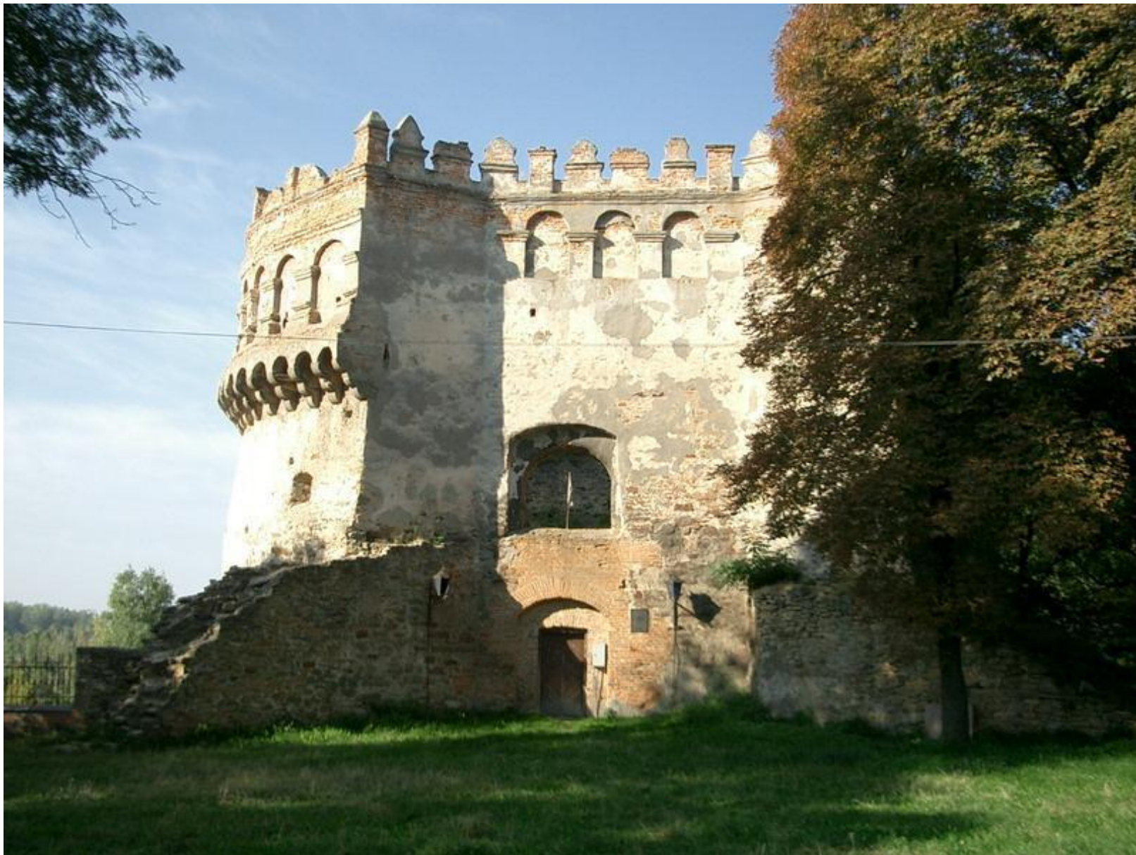
Острожская крепость, Ровенщина