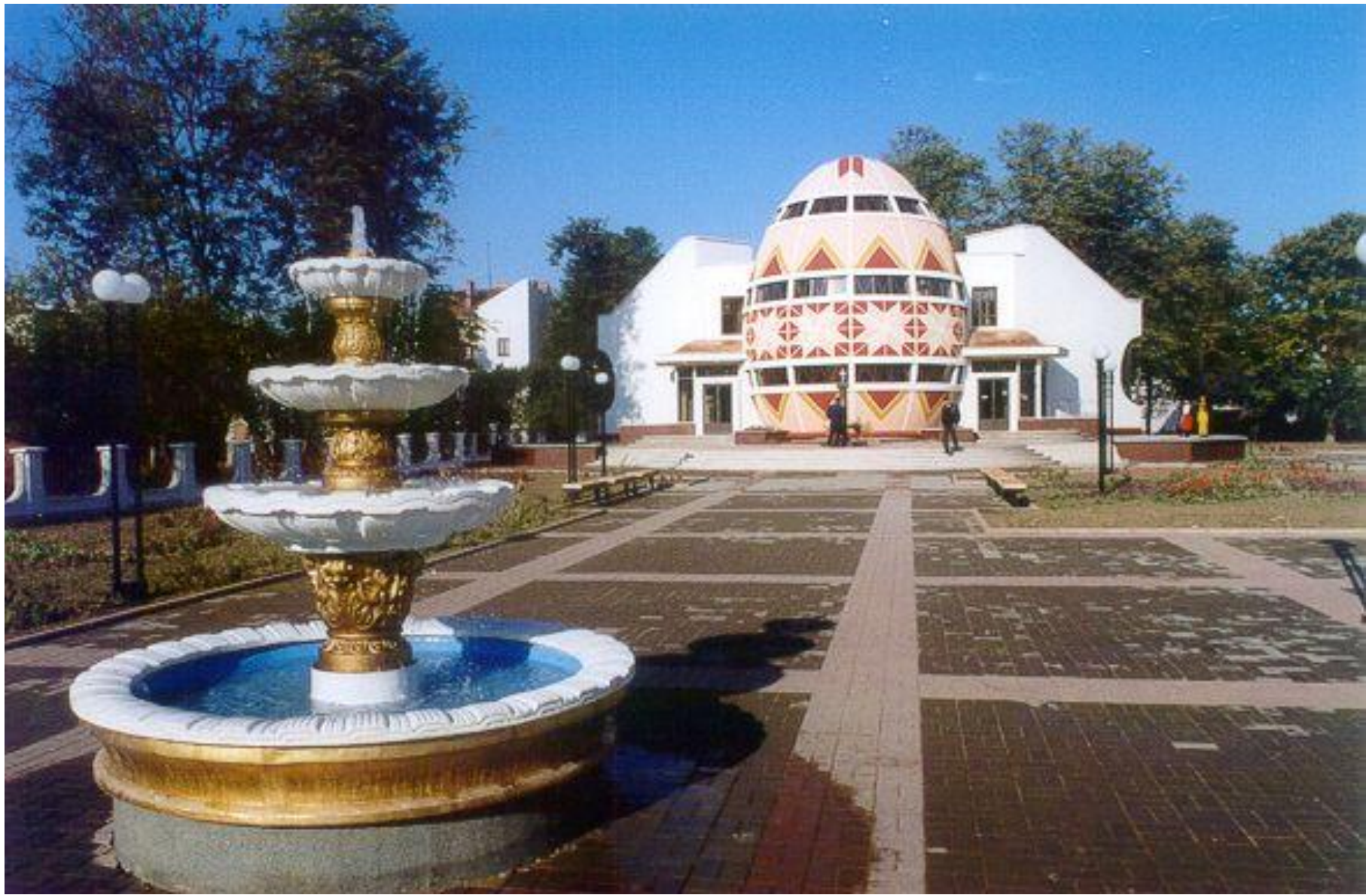
г. Коломия, отель Писанка