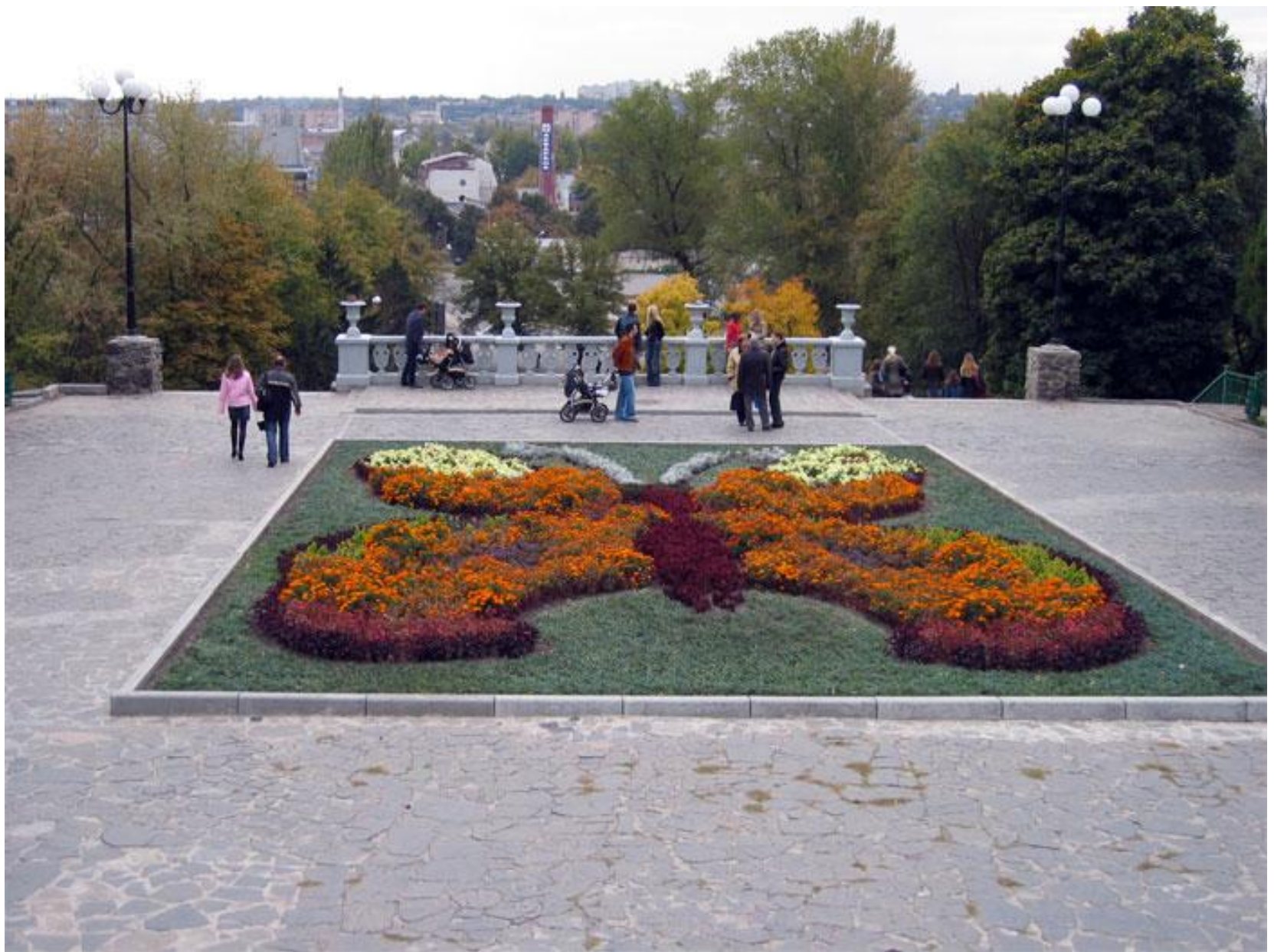
Клумба-бабочка в Харькове