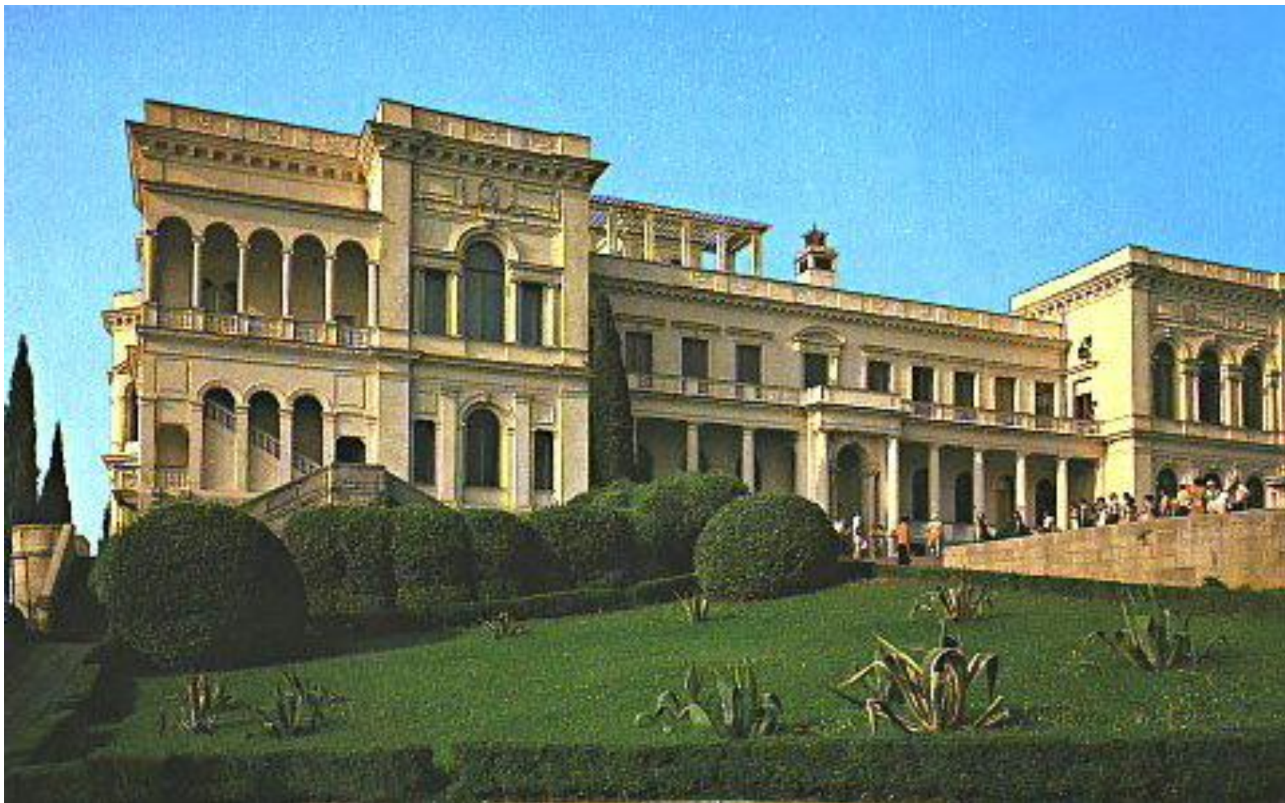
Ливадийский дворец, Крым