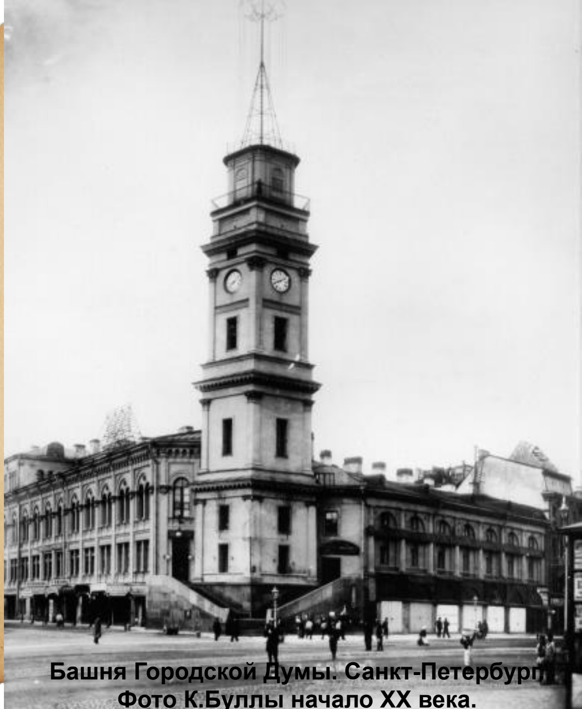
Башня Городской Думы. Санкт-Петербург начало XX века.

Башня первоначально служила пожарной каланчой. С 1825 года она стала одной из передаточных станций светового(оптического) телеграфа, связывавшего Зимний дворец с Царским селом . Чуть позже башню увенчали металлической конструкцией. Здесь вывешивались пожарные сигналы. По ним прохожие могли определить , в каком районе пожар.