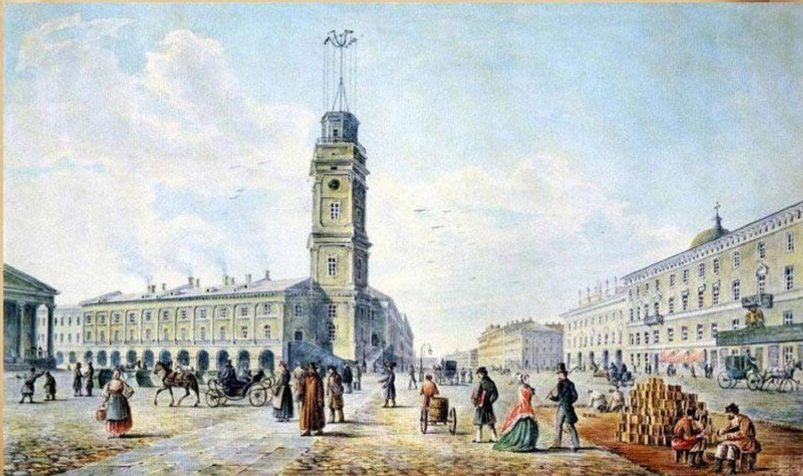
Невский проспект и Городская дума. 1820-е гг. Акварель.

Вскоре рядом с Гостиным двором появилось другое торговое здание с изящным портиком ( арх. Луиджи Руска). А около него поднялась высокая башня Городской думы (арх. Константин Андреевич Тон). На башне укрепили большие круглые часы со звоном. В здании Городской думы собирались те ,кто управлял городом.