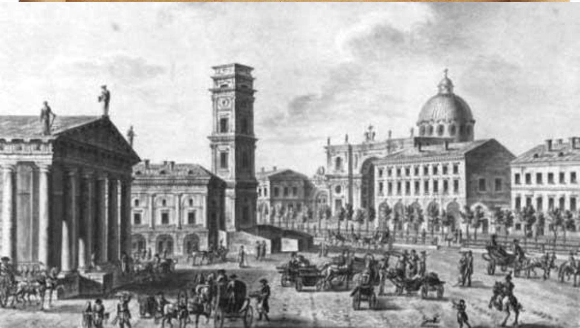
У Гостиного двора и Городской думы. Рис. С. Попова. 1811 г.