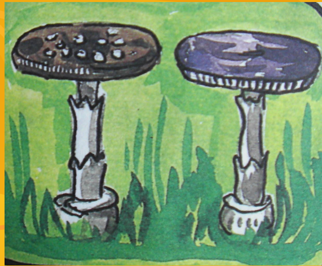
Мухоморы: пантерный и пурпуровый