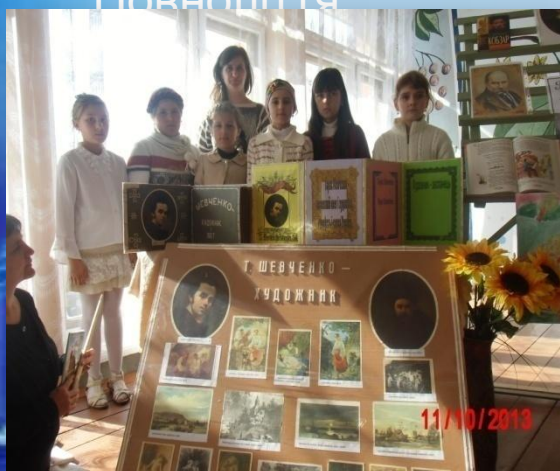
Тиждень образотворчого мистецтва “Т.Шевченко – художник”