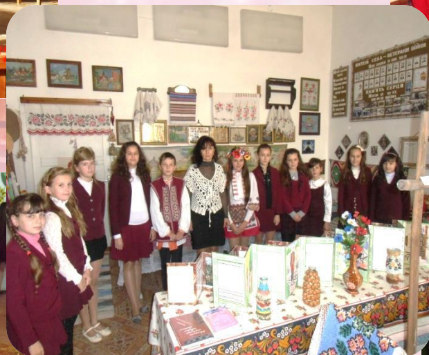
Екскурсія в шкільний музей