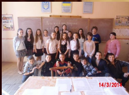
Виховна година “Цастя і горе Карпатської України”