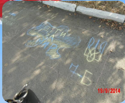
День Миру. Конкурс малюнків на асфальті