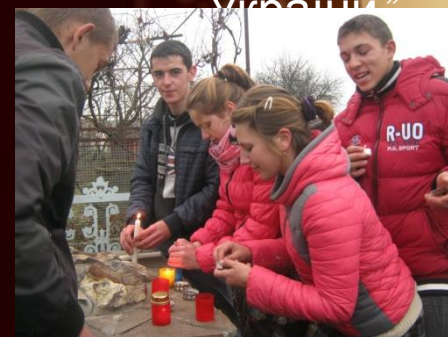
Акція “Запали свічку” присвячена жертвам Голодомору та політичних репресій