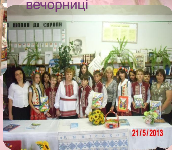
Зустріч з поетесою Ю. 15013