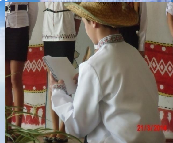
Виховний захід “Уклін тобі, Тарасе!”