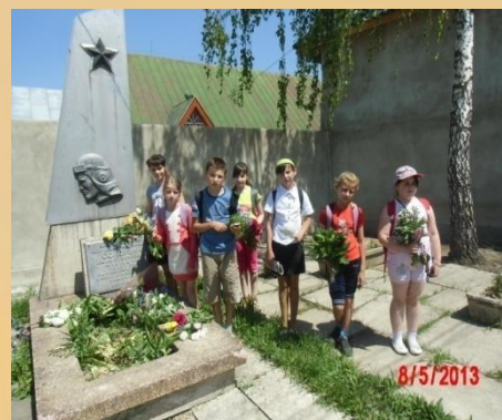
Покладання квітів до пам'ятника загиблomu