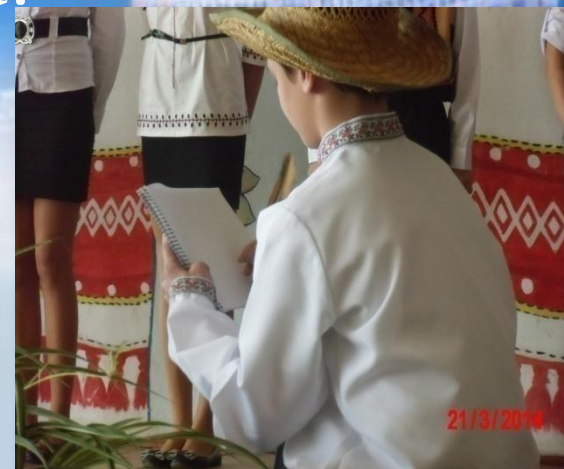
Виховний захід “Уклін тобі, Тарасе!”