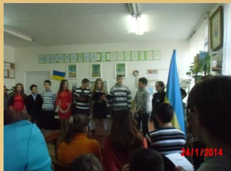
Конференція присвячена пам'яті Героїв Крут