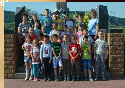
Екскурсії до пам'ятників історії