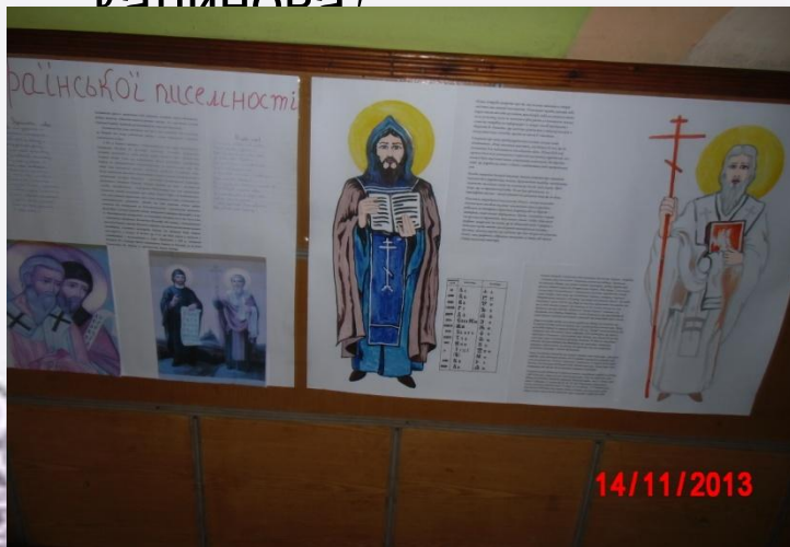
Конкурс стіннівок до Дня української писемності