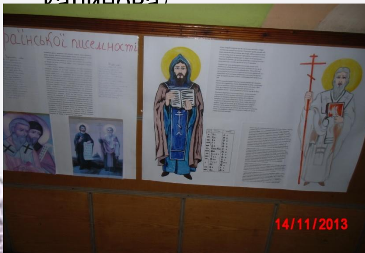
Конкурс стіннівок до Дня української писемності