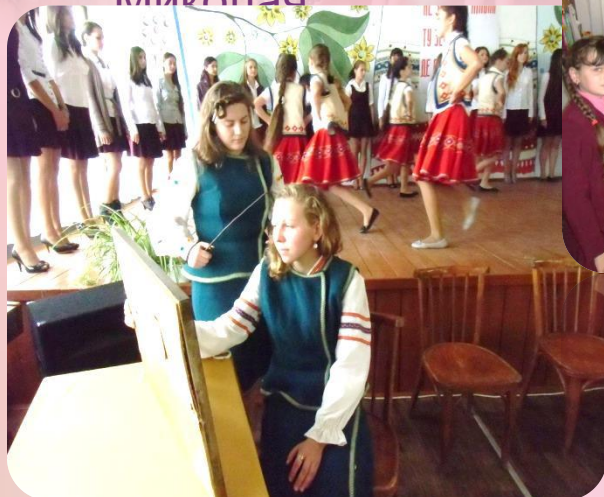
Обласний семінар музеїв