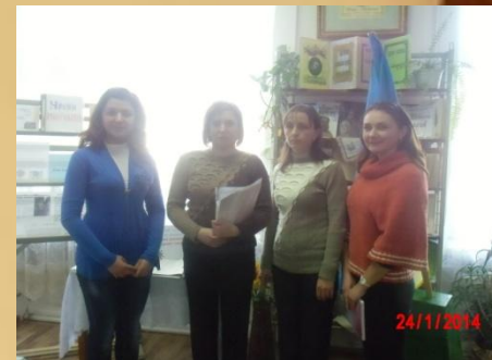
Виступ Лекторської групи до Дня Соборності України