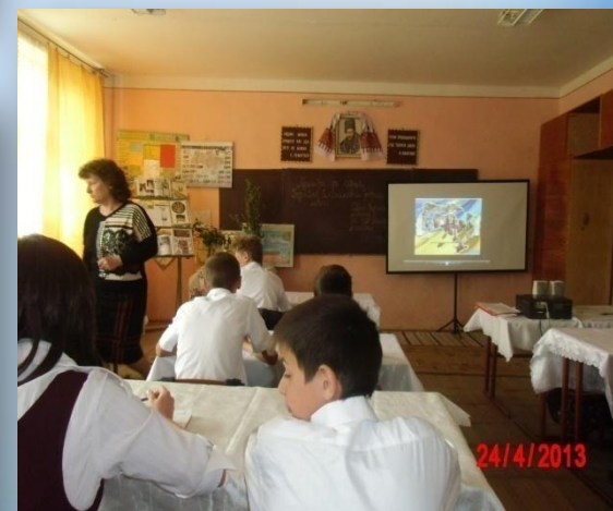
Виховна година на тему: “Символи України”