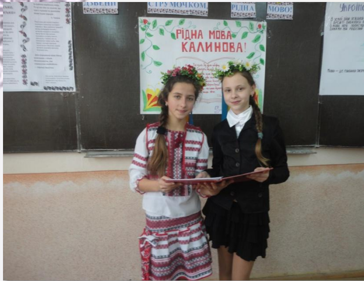
Свято "Рідна мова калинова!"