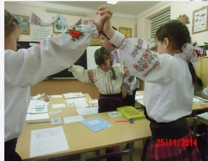
Урок української мови в 2-А