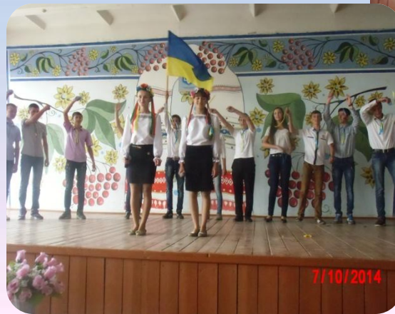
Конкурс патріотичної пісні “Люблю тебе, Україно!”