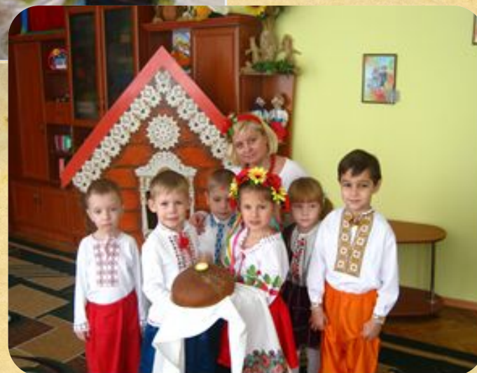
«Хліб усьому голова»