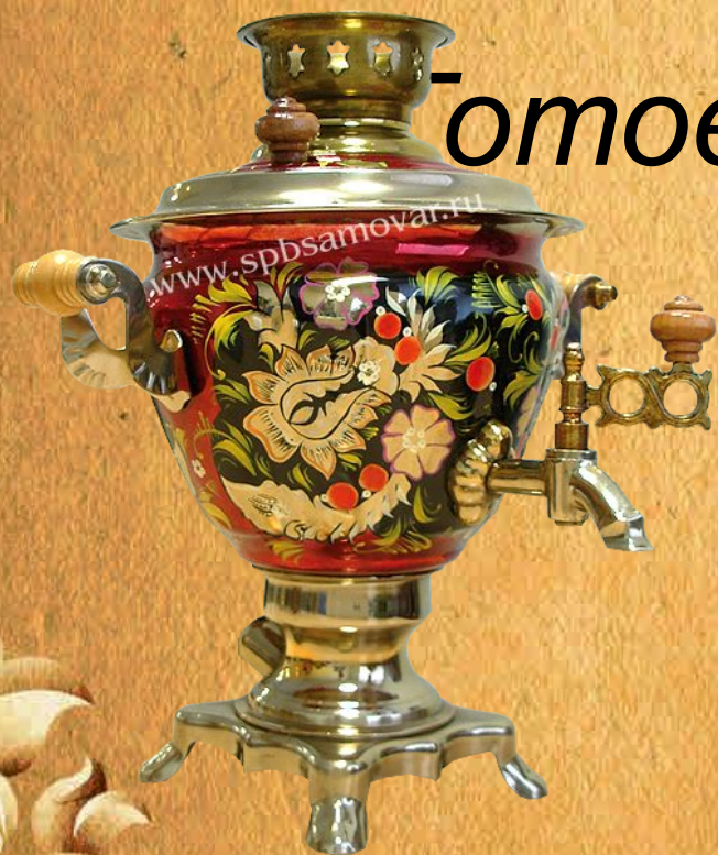
«Хохлома» 2 л