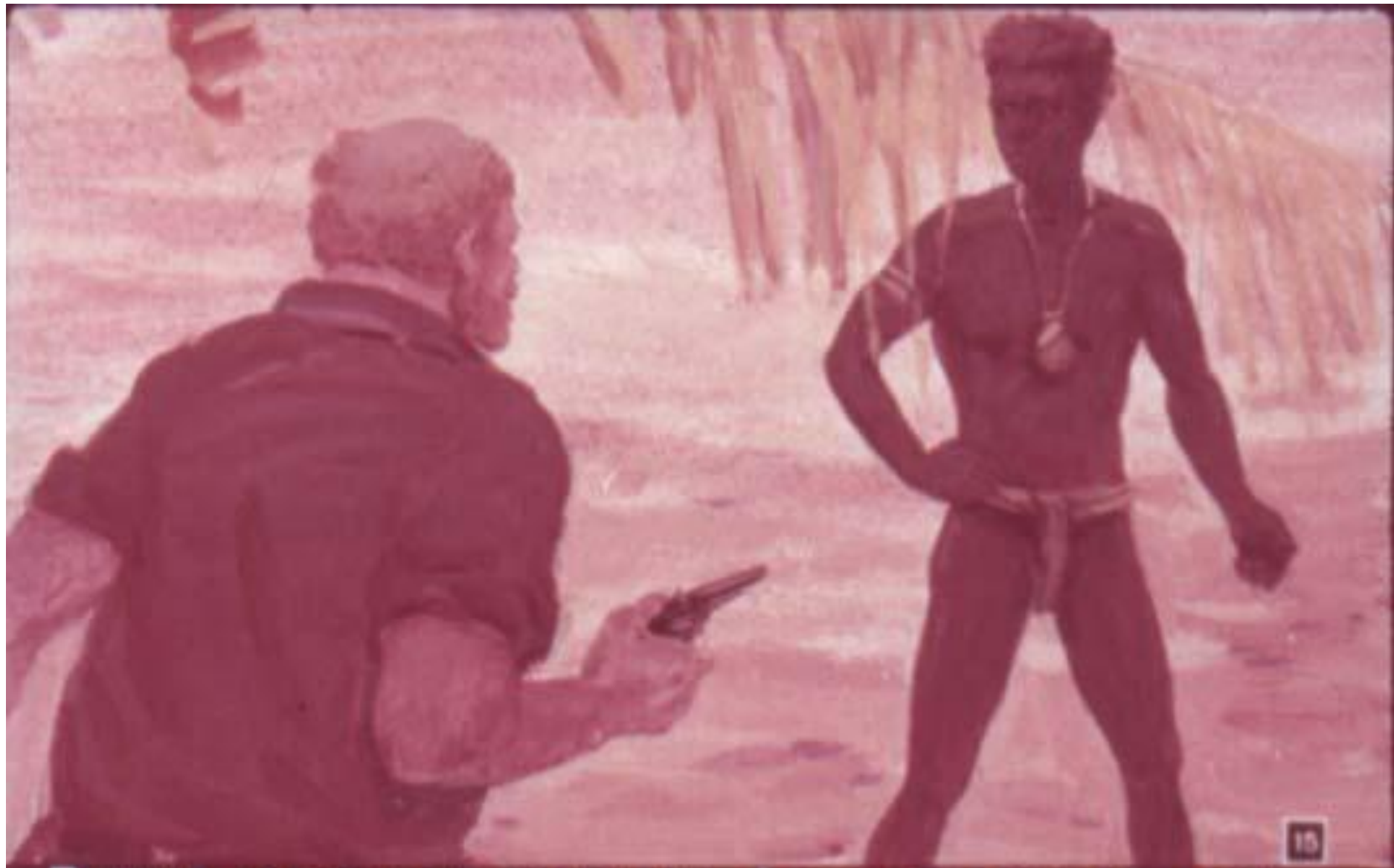
Рыжий голландец вскочил: „А ну проваливай отсюда! – Он выхватил из кармана револьвер и прицелился в Петра. – Убирайся, пока я тебя не продырявил!“