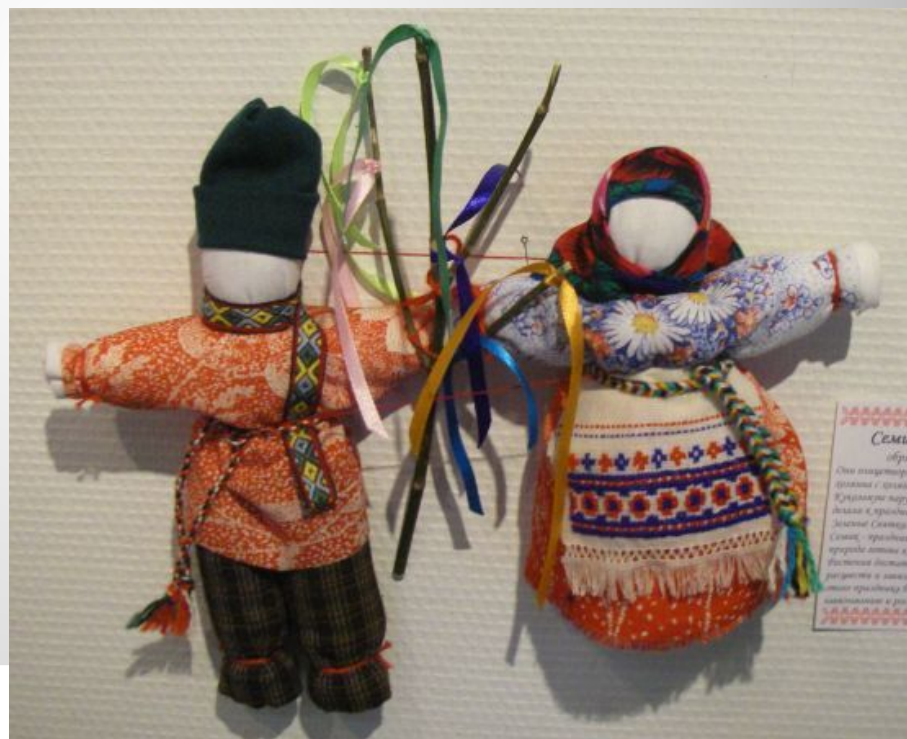
Семик Обряд Они изготавливались из ткани с вышивкой Кривошею веру С дочери в праздник дочери Семик Семик, праздник и приводит к ней к вышивке и вышивке разрешает и вышивке ткане праздник был наполнен и радость