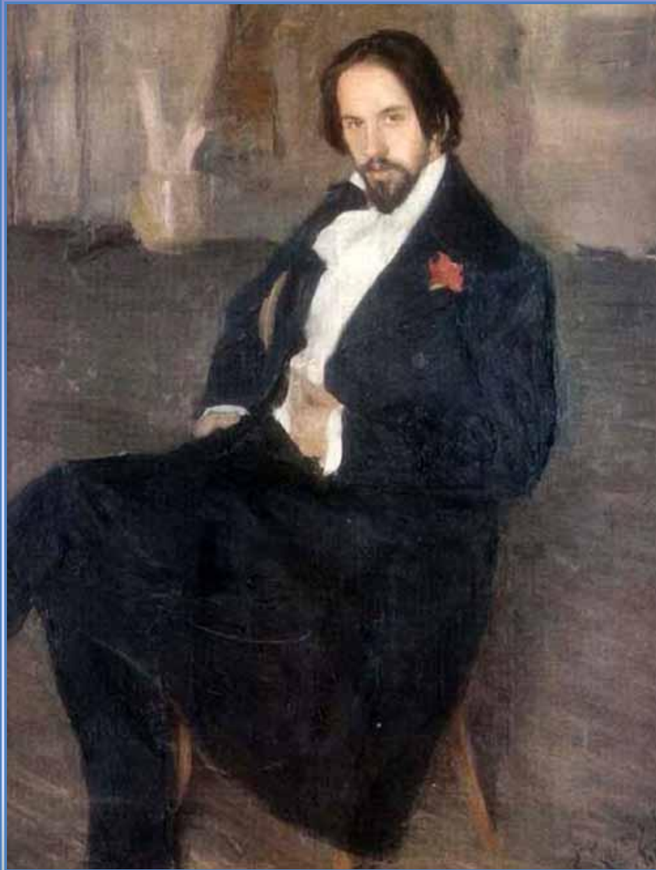
БИЛИБИН ИВАН ЯКОВЛЕВИЧ (1876-1942)