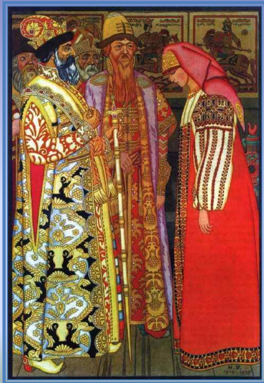
Иллюстрация к русской народной сказке «Поди туда — не знаю куда, принеси то - не знаю что...»

Русской сказочной теме художник посвятил все свое творчество, серьезно для того подготовившись: много ездил по России, особенно по Северу, с интересом изучал русское народное и декоративное искусство.