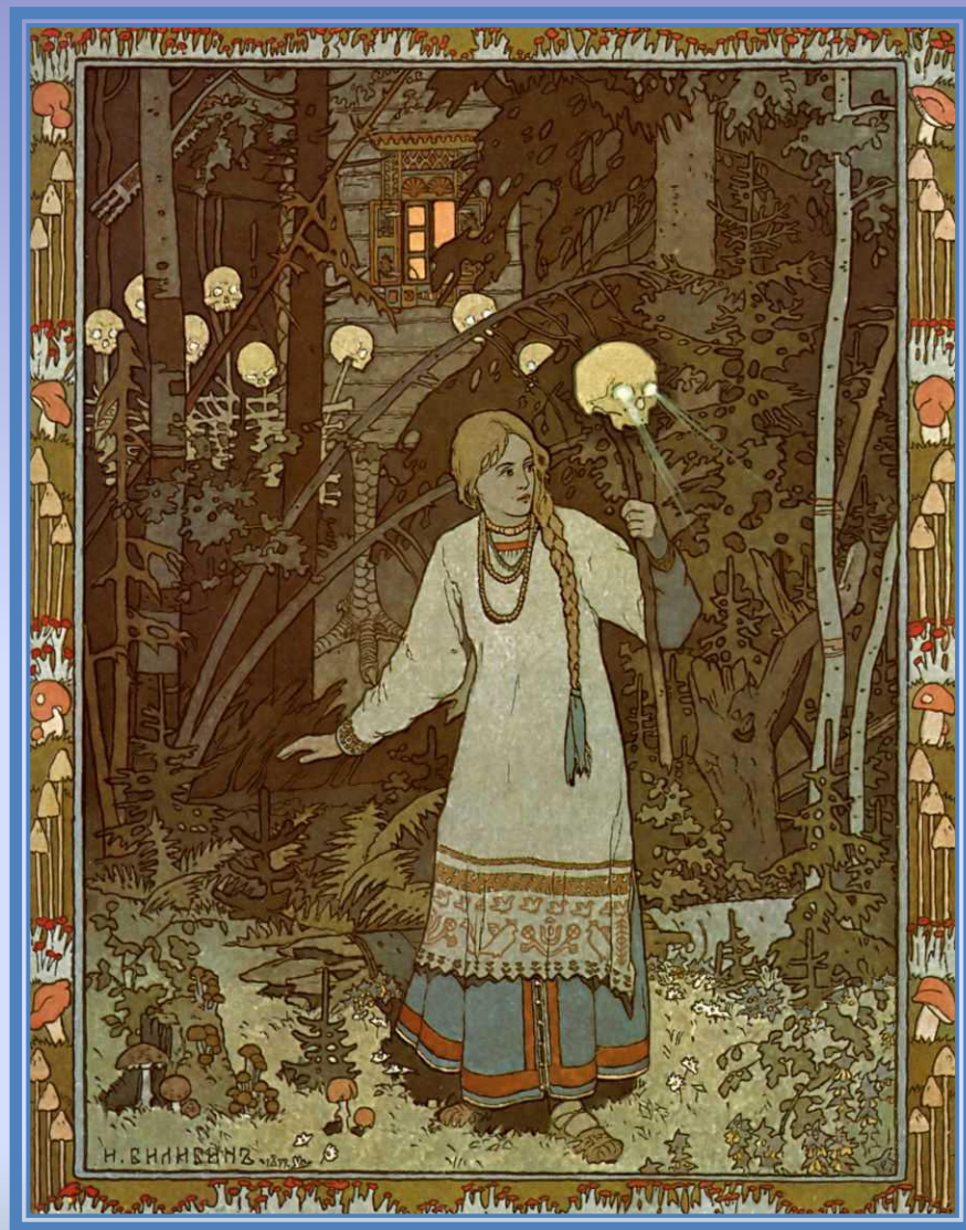
Билибин Иван Яковлевич. «Обложка к сказке «Василиса Прекрасная»»