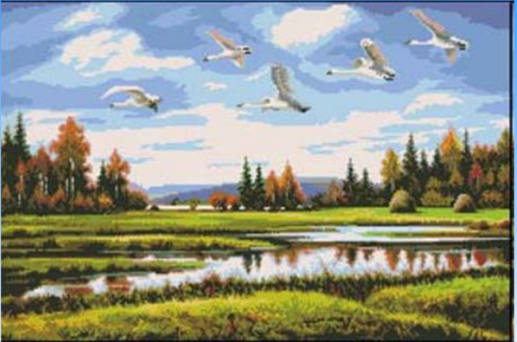
Работа в вышивке