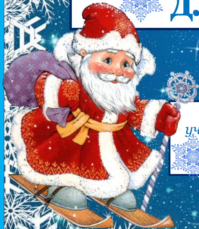
Таблица деления для уч-ся 2-4 класса

Автор: Панова Валентина Викторовна учитель начальных классов МБОУ «Селекционная СОШ» Льговского района Курской области 2015 год