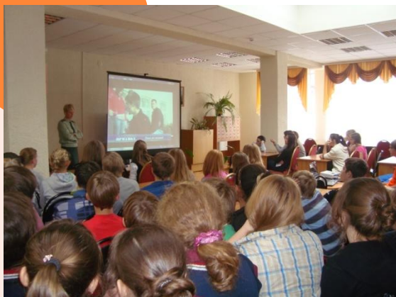
«Нет – наркотикам!» (взаимодействие с Наркоконтролем)