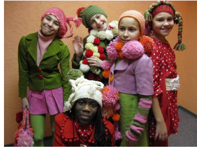
Модельная студия «Чародейка»