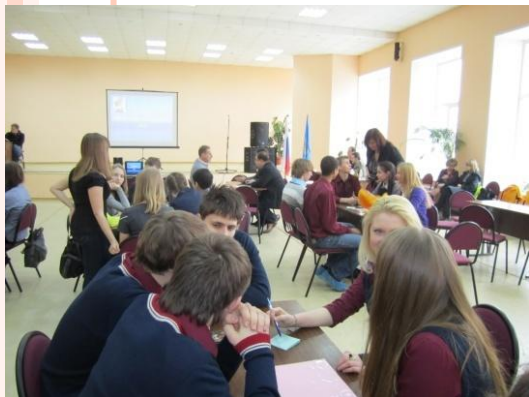
Участие в городских интеллектуальных играх

Цель: создание социально – психологических условий для успешного развития воспитанников школы-интерната.