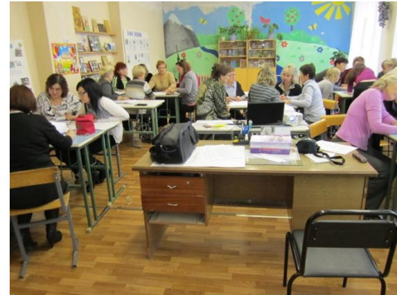
Проблемный семинар «От ключевых компетенций - к внеурочной деятельности»