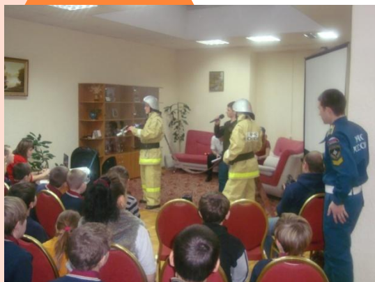
Ток-шоу «Твой выбор» (с МЧС)