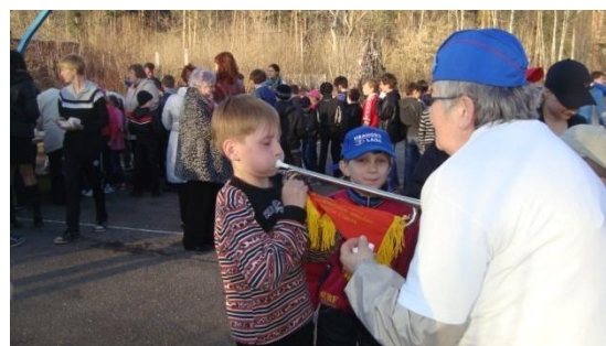
Сотрудничество с Московским и пионерами