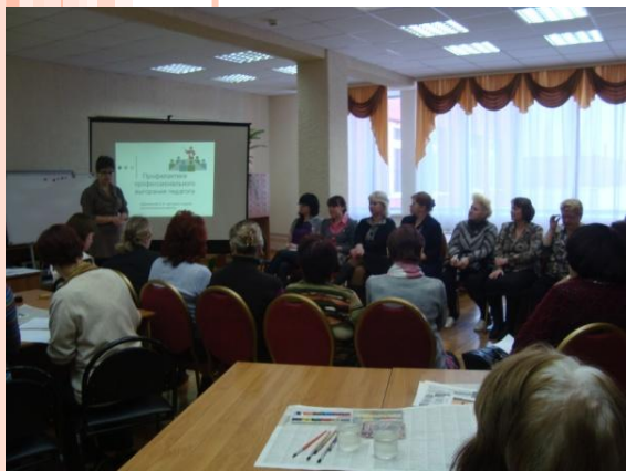
Семинар-практикум по профилактике педагогического выгорания

Цель : охрана и укрепление здоровья учащихся, приобщение их к ценностям здорового образа жизни.