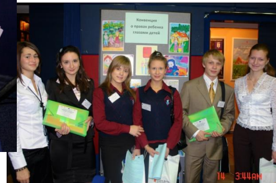
Конференция по правам ребенка, Москва