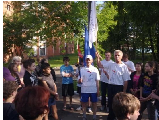
Участие в международной акции «Бег мира»