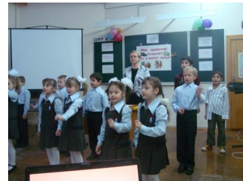
Воспитательный час «Мир профессий большой – труд в почете любой» Корзина Н.А.