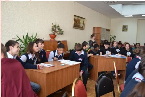
Викторина по истории «Государственные символы России»

Цель: целенаправленное и систематическое формирование у детей нравственных качеств, формирование духовно и физически здорового человека. Неразрывно связывающего свою судьбу с будущим родного края и страны, способного встать на защиту интересов России