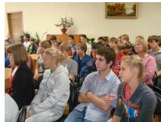
Дискуссионный клуб «Застрявшие в сети»