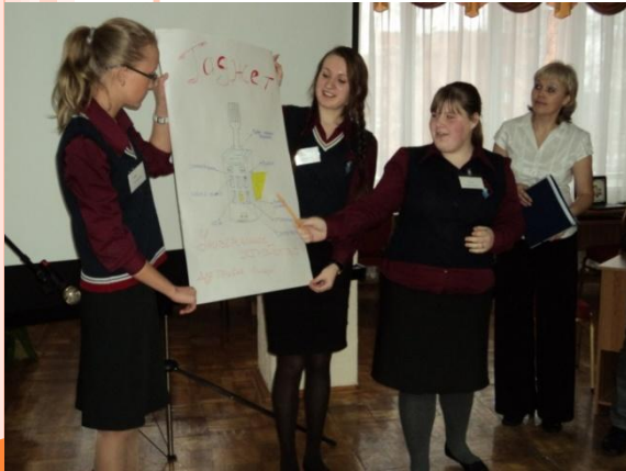
Сюжетно-ролевая игра «Рынок профессий» Кудряшова Е.Н.

Цель: формирование у школьников реалистичного самовосприятия и уровня притязаний, раскрытие и развитие способностей, воспитание трудовой мотивации, развитие системы навыков по уходу за собой, жилищем, овладение профессиональными умениями и ознакомление с миром профессий, содействие принятию обоснованного решения о выборе направления дальнейшего обучения