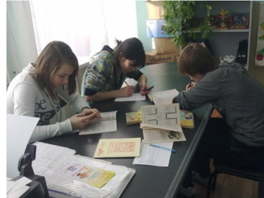
Подготовка к мероприятиям членов Школьного Совета