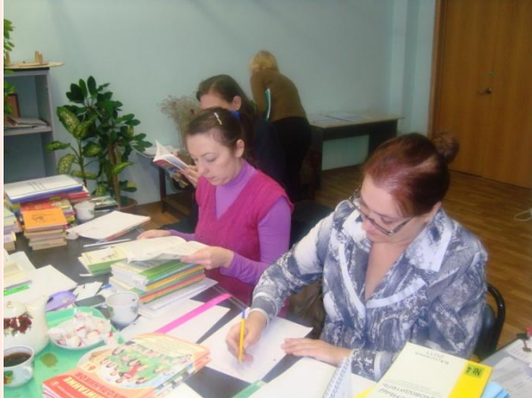
Работа творческих групп по систематизации практических мероприятий по Проектам

Цель: определение и формирование основных компетенций в воспитании ребенка, которые приведут к формированию личности; создание воспитательной среды, обеспечивающей формирование компетенций учащихся