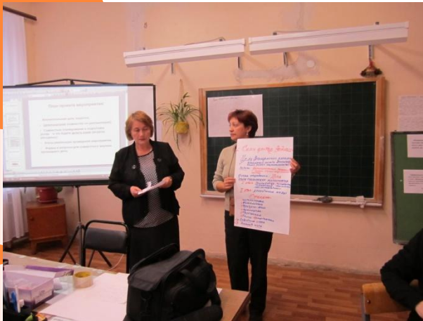
Семинар с деловой игрой «Моя работа»