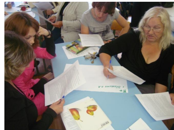
Психологический практикум «Мы - коллеги»