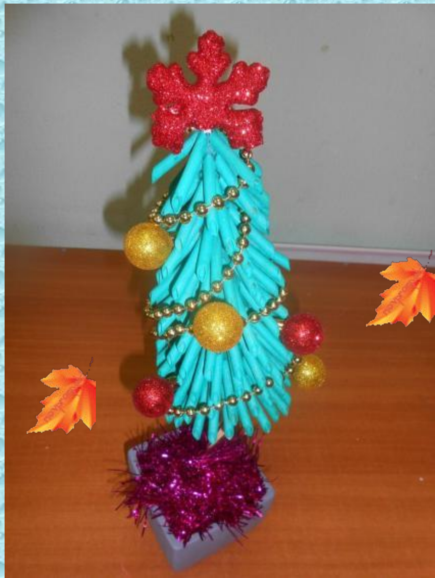
«ЕЛОЧКА – КРАСАВИЦА » (МАКАРОНЫ)