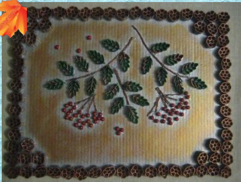
«ВЕТКА РЯБИНЫ» (МАКАРОНЫ)