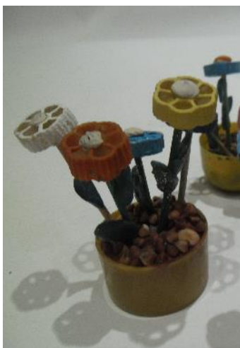
Банки, крышки, крупы