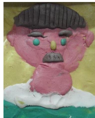
Пластилин -> пластилинография