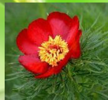
Пион тонколистный (воронец) занесен в Красную книгу РФ.