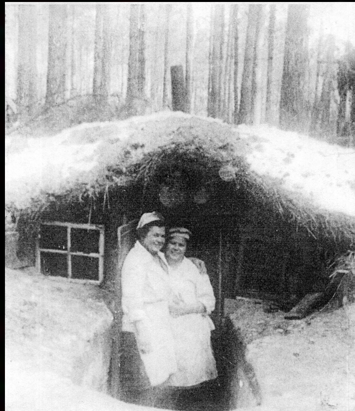
У фронтовой землянки.