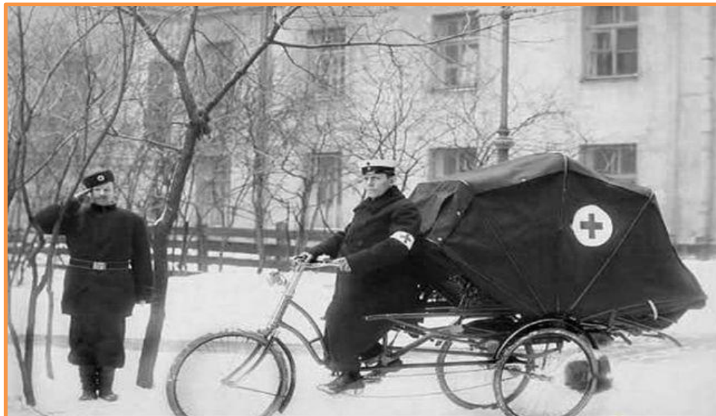
Велокарета скорой помощи, начало XX века

Так же велосипеды используются в «скорой помощи» Лондона, Таллина и многих других городов.