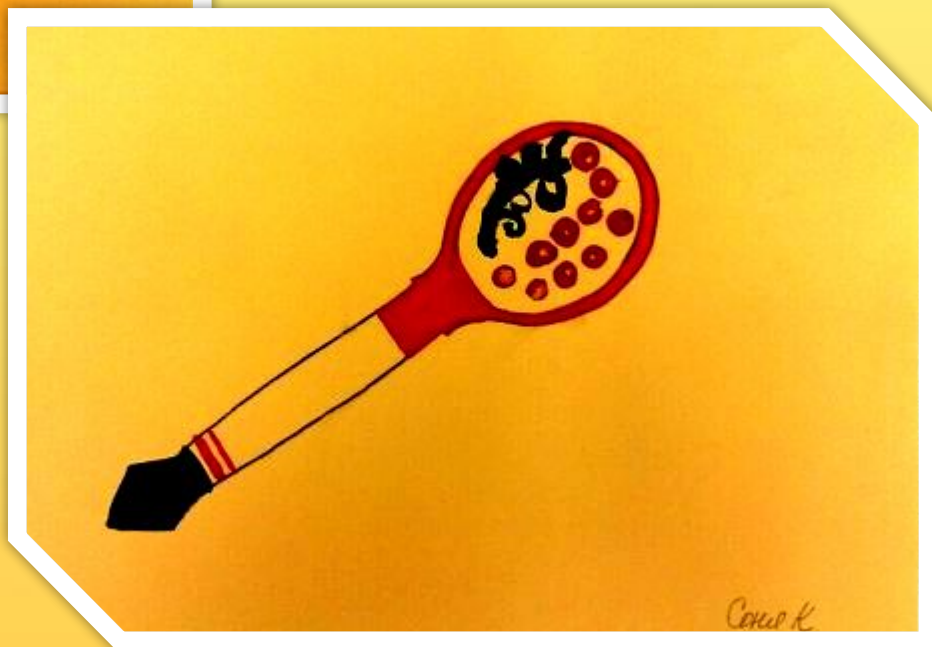
София Кузнецова 6 лет