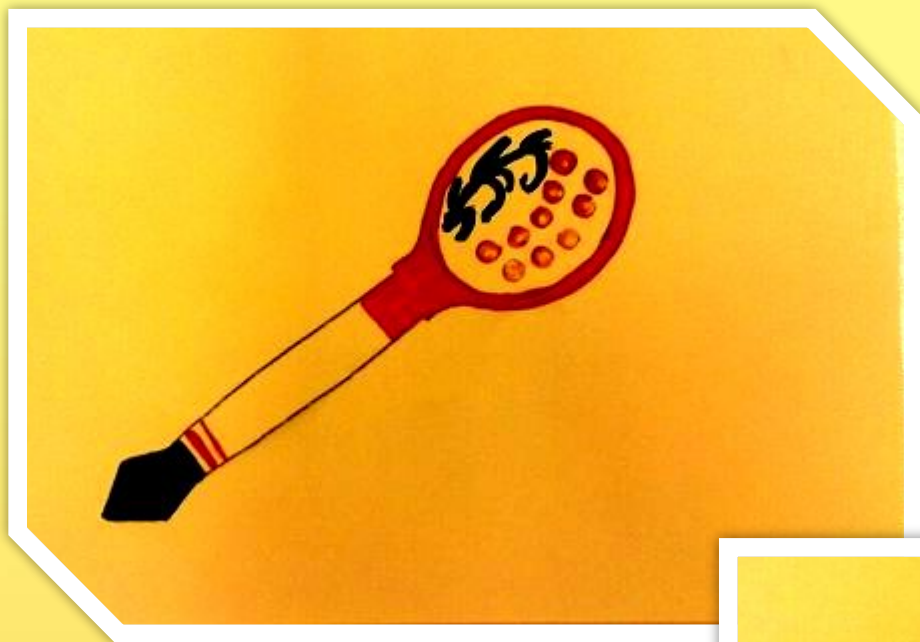
Эмма Халоян 6 лет