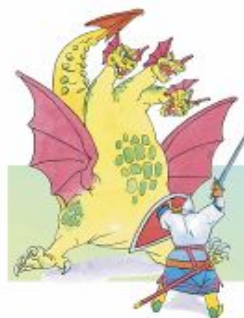
Сражается Добрыня со змеем