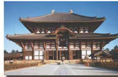
Буддийский храм в городе Нара

Каждый буддист должен также почитать три драгоценности буддизма : Будду, Дхарму и сангху . Будда – это всеведущее просветлённое существо, которое сумело достичь вершин духовного развития. Будда достиг просветления – обдхи и успокоения – нирваны , тем самым избавившись от сансары и получив освобождение. Дхарма – это Закон существования человека, открытый Буддой. Суть его изложена в четырёх благородных истинах буддизма, с которыми вы уже познакомились. Будда же сообщил Закон ученикам в виде Слова – бесед и проповедей, которые в буддизме именуются сутрами . Сутры несколько столетий предавались из поколения в поколение устно, прежде чем были записаны на специальном языке, придуманном буддийскими монахами.