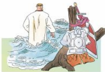
Купается Добрыня в Пучай-реке

3. Рассмотрите рисунки. Найди в тексте предложения, которые они иллюстрируют. Составь рассказ по рисункам.