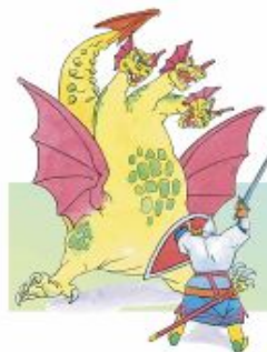
Сражается Добрыня со змеем