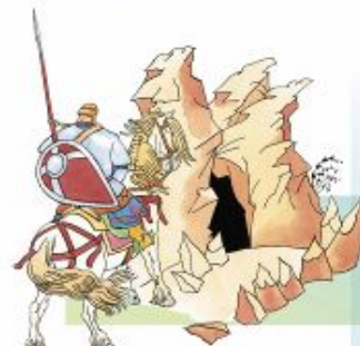
Открылся путь к пещере