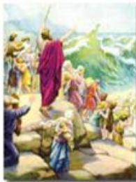
Переход евреев через Чермное (Красное) море

Итак, евреи покинули Египет. Однако фараон напавился за ними в погону с войском, настигнув их у берегов моря. И Бог снова помог евреям: воды моря