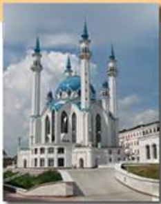
Мечеть Куд-Шариф в Казани

совершения коллективной праздничной молитвы, перед которой произносится проповедь.