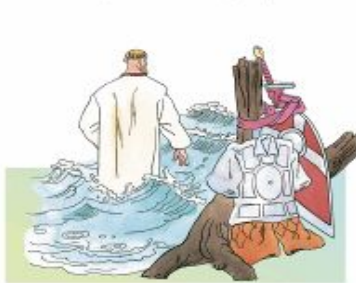
Купается Добрыня в Пучай-реке

3. Рассмотрите рисунки. Найди в тексте предложения, которые они иллюстрируют. Составь рассказ по рисункам.