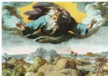
Бог создаёт Землю

Согласно Библии, Бог создал Землю, её обитателей, в том числе и человека за шесть дней. В первый день были сотворены небо и земля, день и ночь, на второй день – небо. На третий день земля была отделена от воды, которая образовала моря. На суше стали расти травы и деревья. В четвёртый день Бог сотворил небесные светила. Отныне солнце освещало землю днём, а луна и звёзды – ночью. На пятый день Богом были соз-