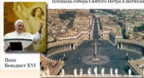
Папа Бенедикт XVI