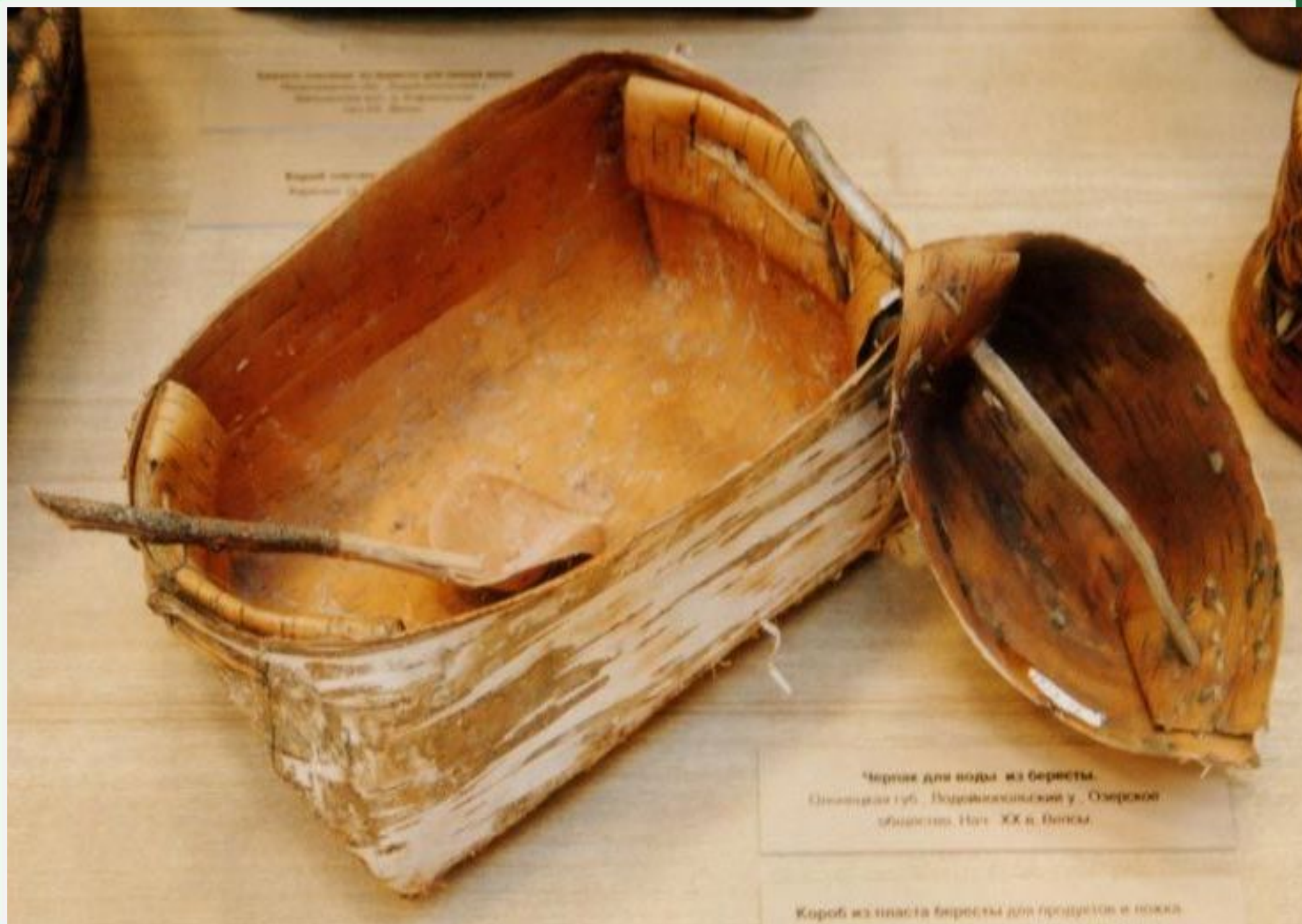
Черепок для воды из бересты. Синьковский губ. Издрывинский у. Озерской области. Нач. XX в. Белая.