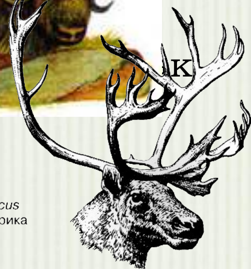
КАРИБУ Rangifer arcticus Северная Америка