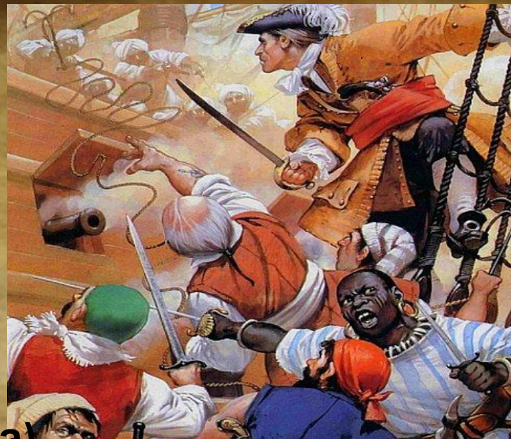
Эдвард Тич (Черная Борода)