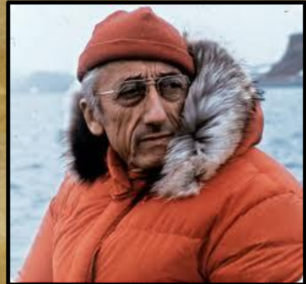
Жак Ив Кусто