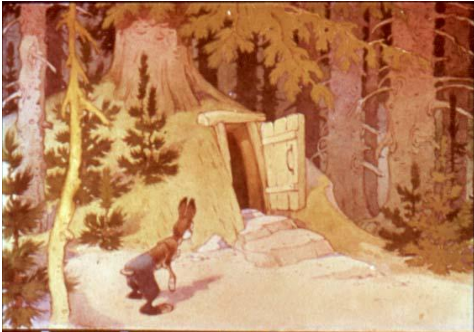
Дом лисы Лариски под ёлкой. Внутри просторно, сухо.