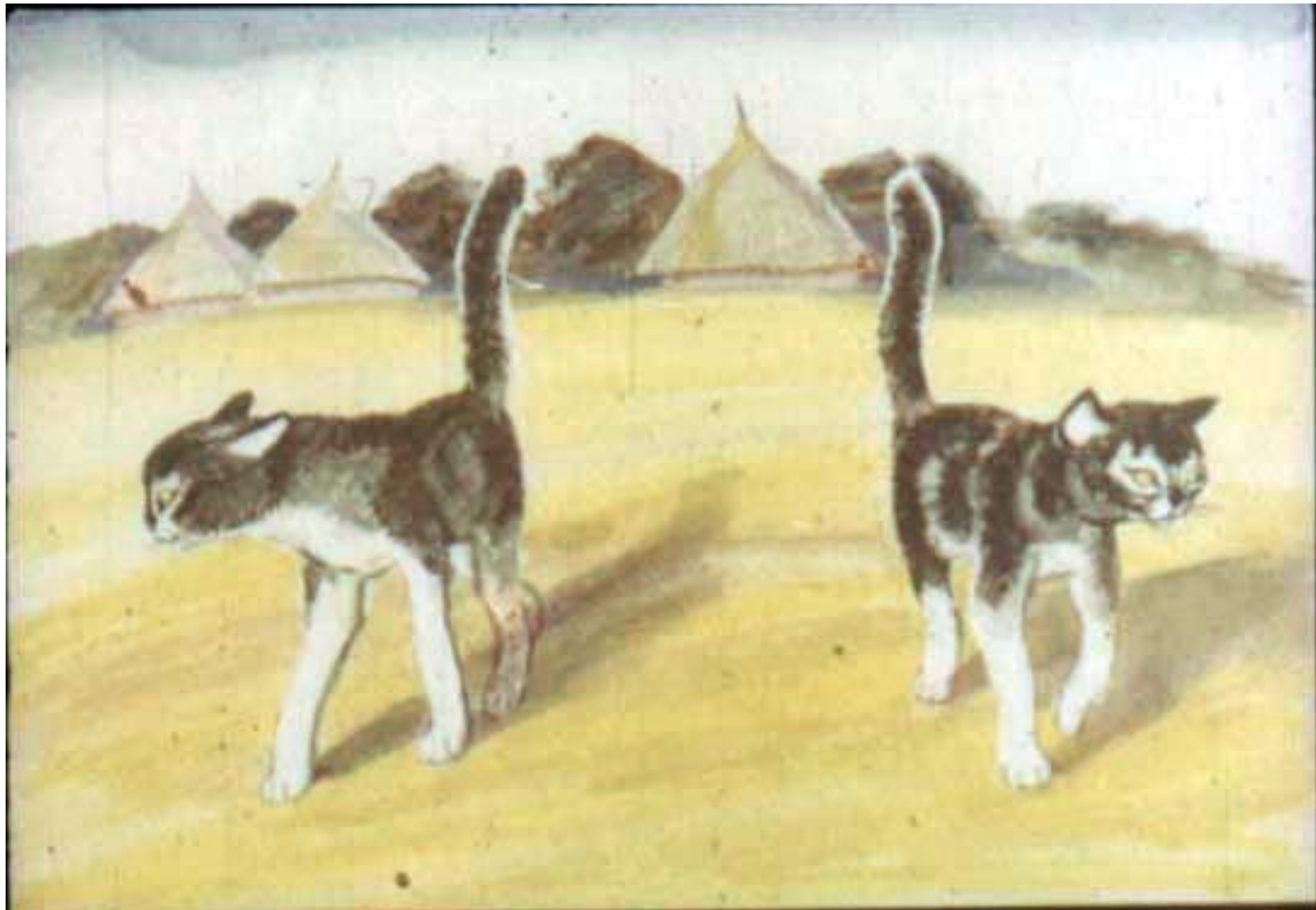
Так и ушли обе кошки ни с чем, не глядя друг на друга. [15]