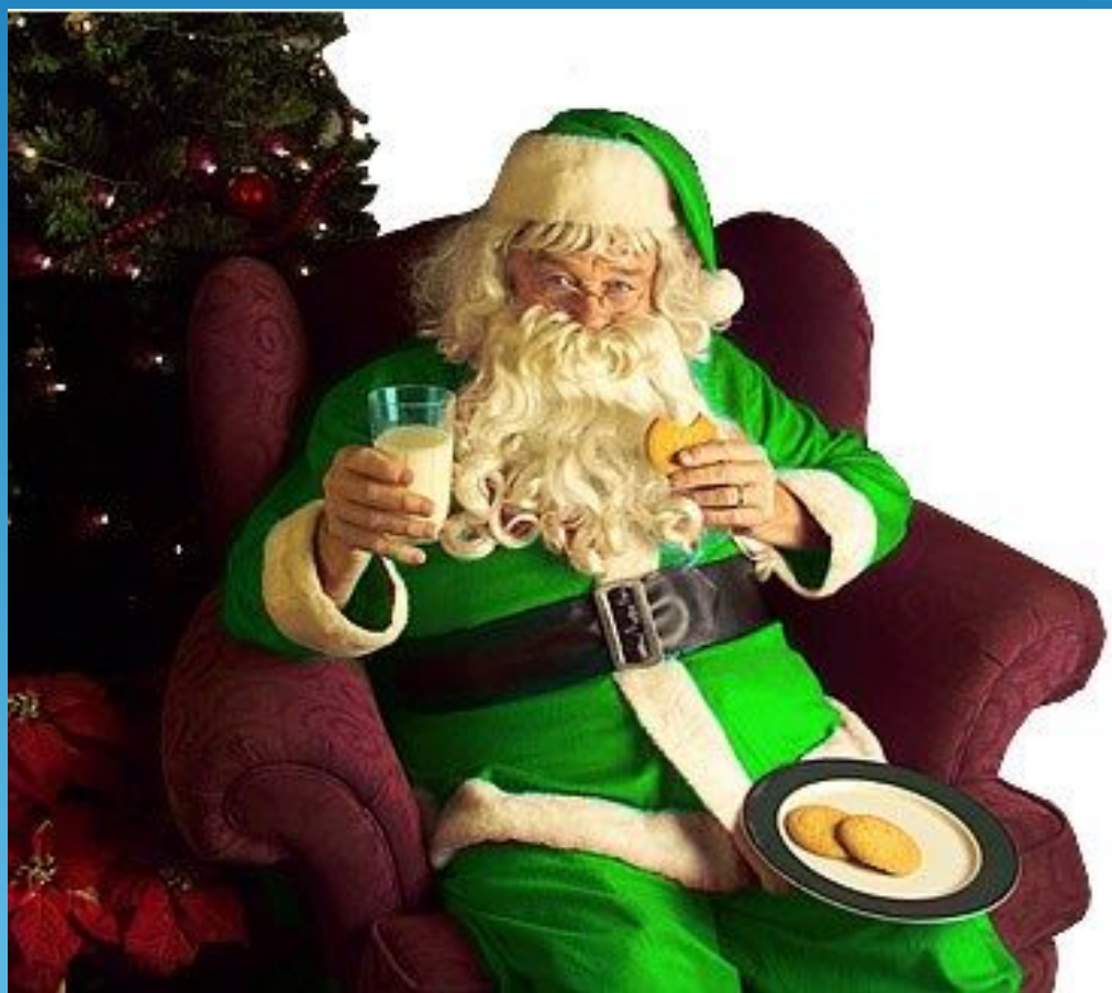
Father Christmas in a green coat

Ни для кого не секрет, что Англия и Америка празднуют и чествуют Рождество куда больше, чем Новый год. Маленькие британцы ожидают подарки не от Санты, а от Отца Рождества (Father Christmas). Именно так изначально называли доброго бородатого волшебника в зеленом облачении, разносящего гостинцы.