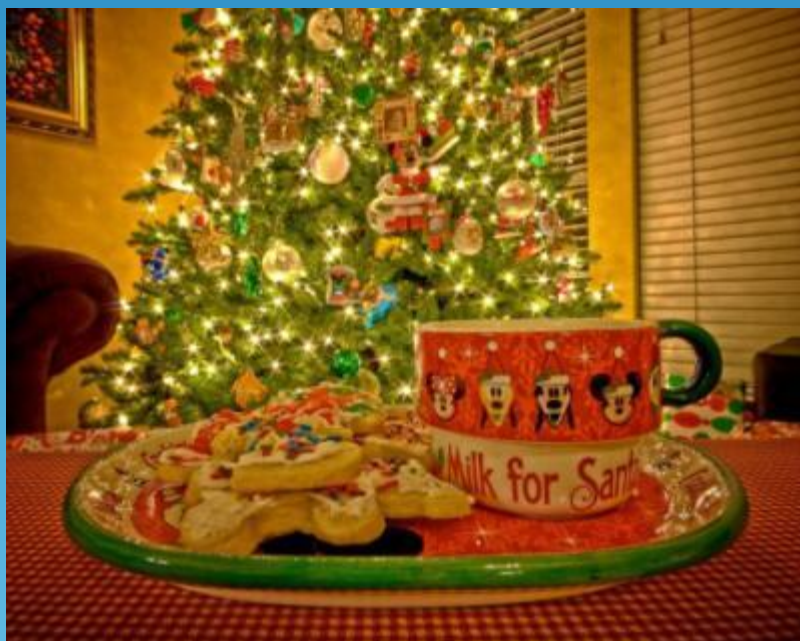
Milk and biscuits