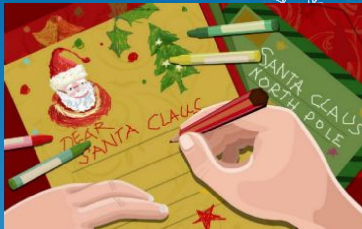
A letter to Santa

Детвора подбрасывает письма с пожеланиями в камин и ожидает золотые монетки и подарки в специальных рождественских носках и чулках.