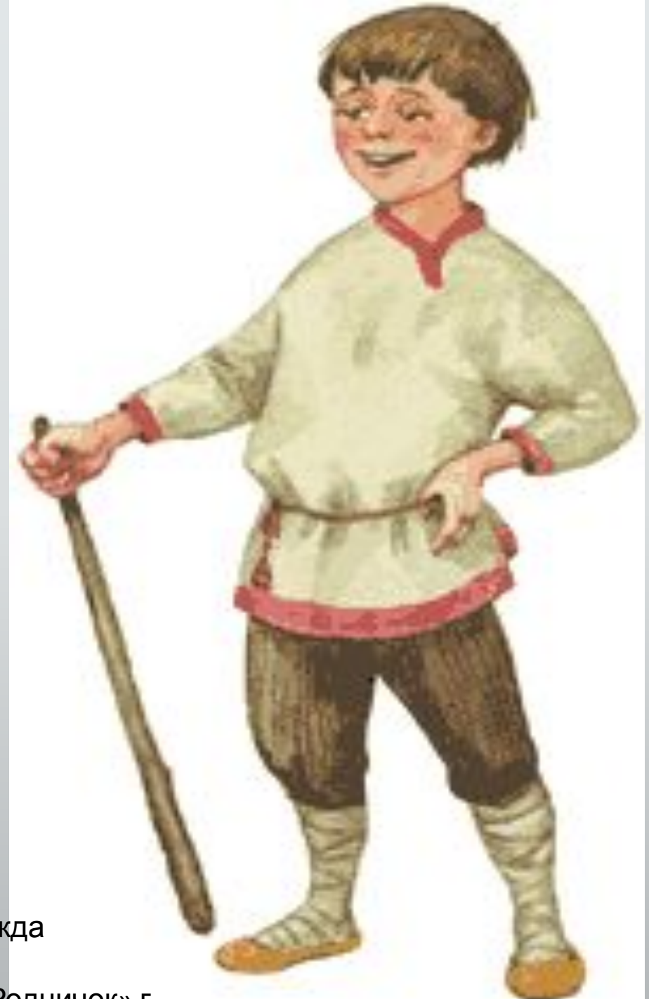
Автор: Фаина Надежда Владимировна МБДОУ «ЦРР – д/с «Родничок» г.